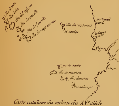
Carte catalane du milieu du XV e siècle