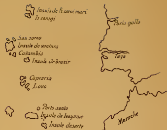
Carte de Soleri (fin du XIV e siècle)