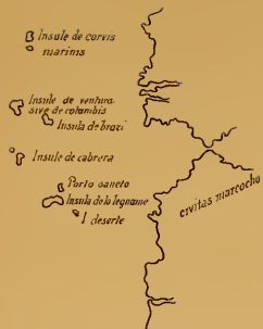
Atlas médicéen de 1351