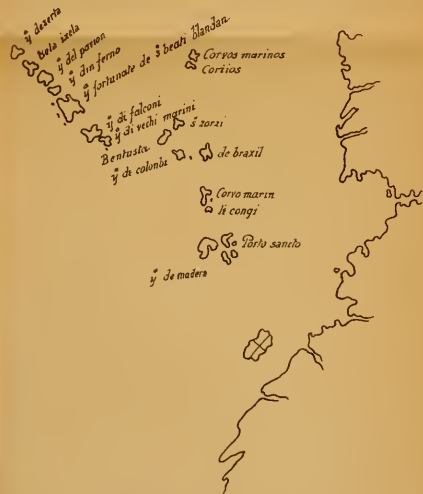
Andrea Bianco 1448