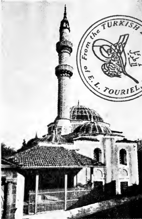
RHODES - SOLIMAN'S MOSQUE