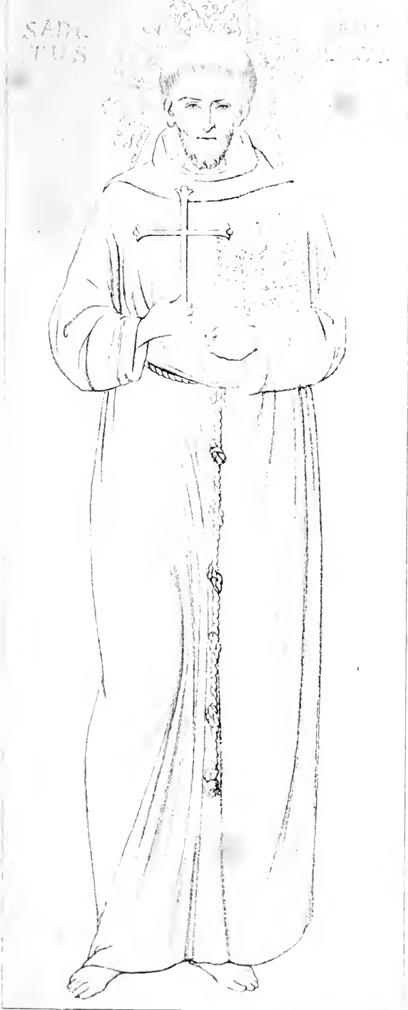
Portrait peint par Giunta Pisano sur la porte de la Grande Sacristie d'Assise.