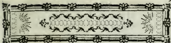
TABLE DES SOMMAIRES DU TOME SECOND.