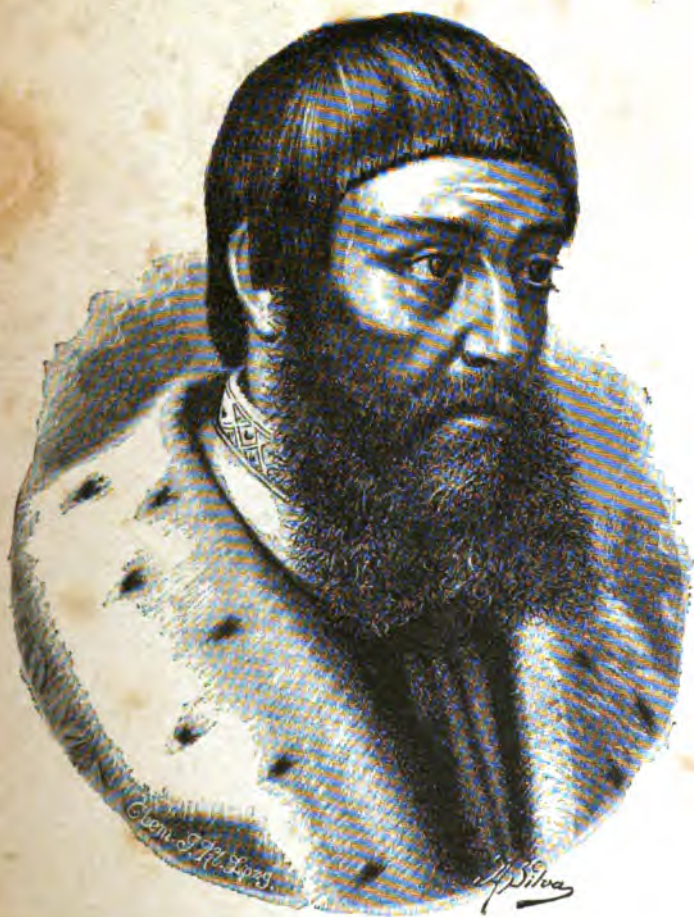
EL-REI D. MANUEL (O VENTUROSO)