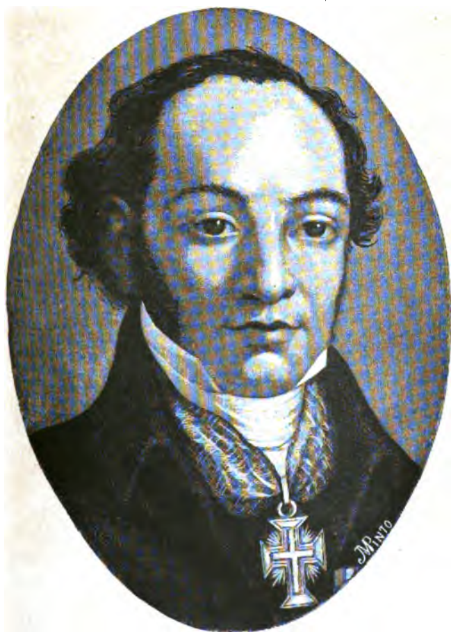
JOSE CORRÊA DA SERRA