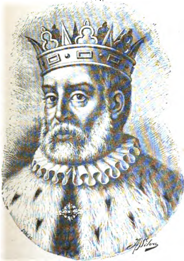
EL-REI D. JOÃO III