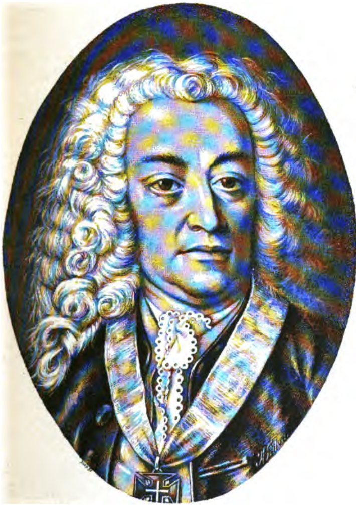
MARQUEZ DE POMBAL