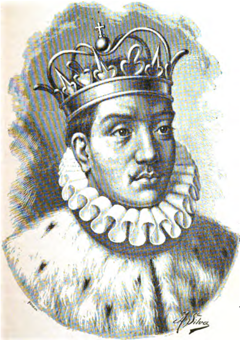
EL-REI D. SEBASTIÃO