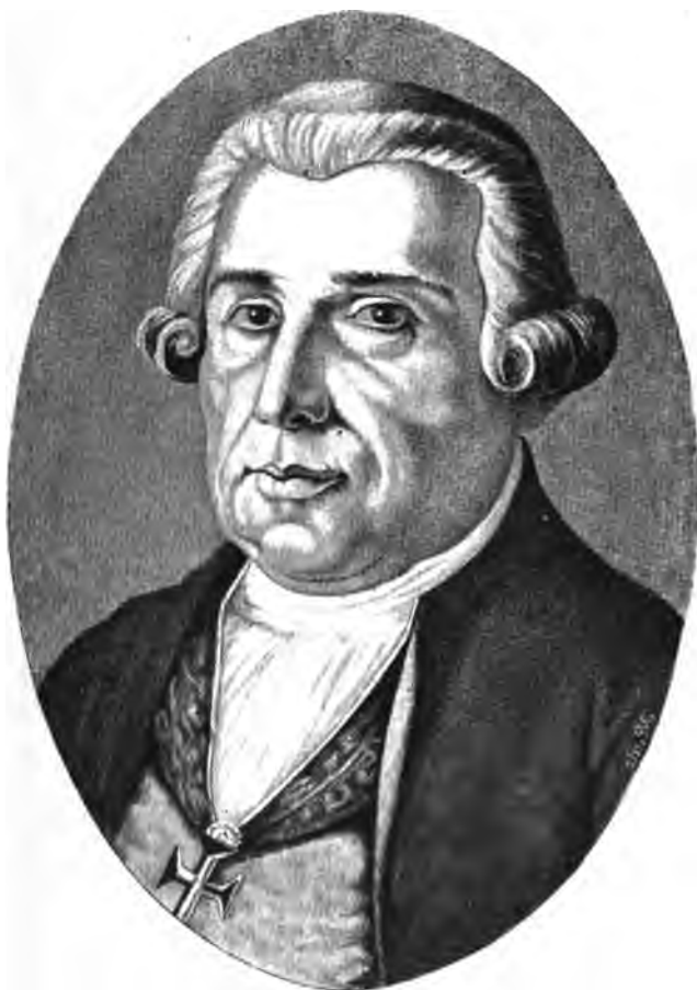
JOAQUIM MACHADO DE CASTRO