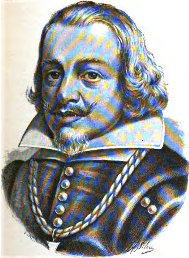
D. JOÃO IV