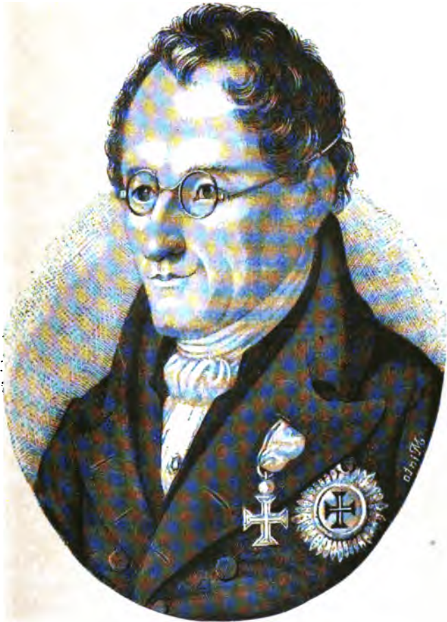
SILVESTRE PINHEIRO FERREIRA