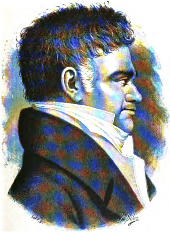
DOMINGOS ANTONIO SEQUEIRA