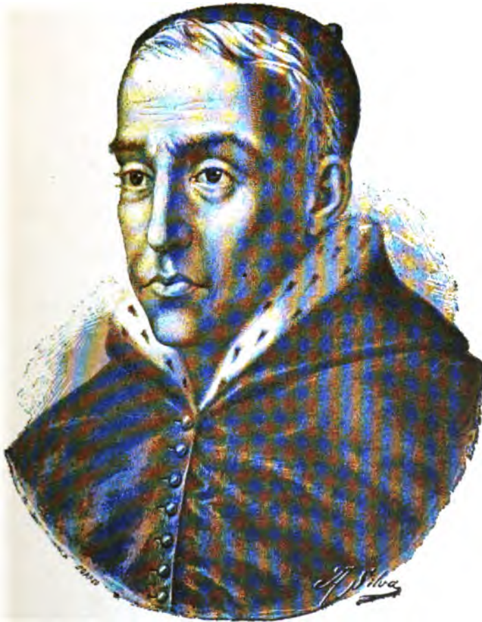
CARDEAL D. HENRIQUE