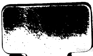
Fig. 278935 e. 4