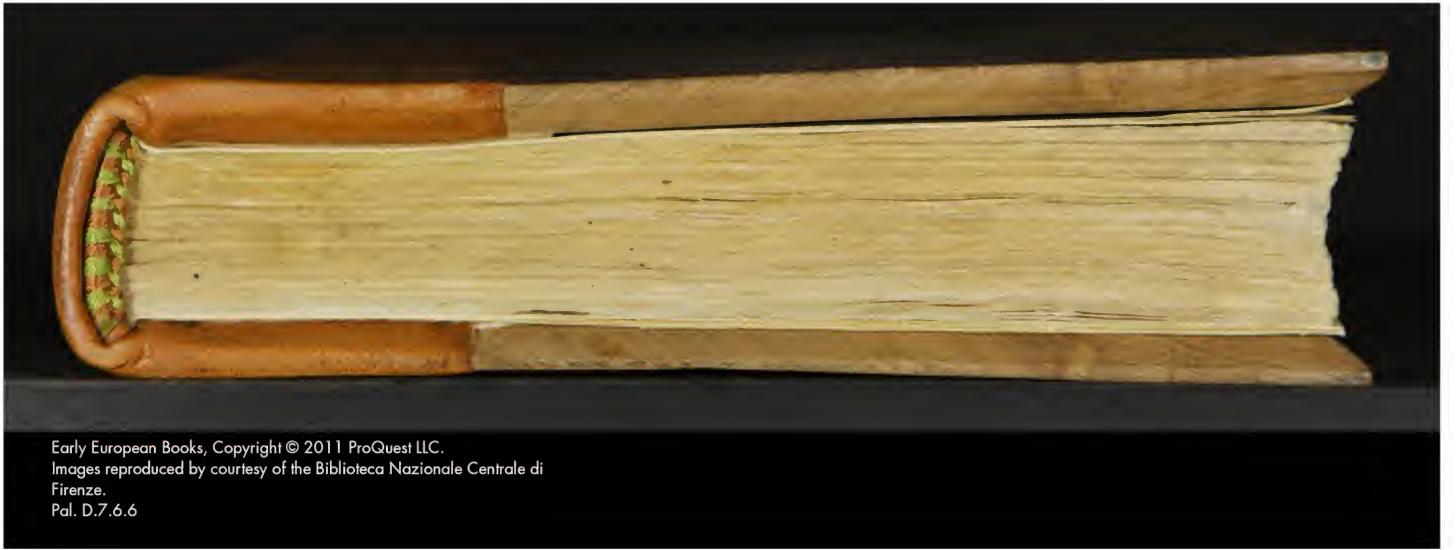
Pal. D.7.6.6