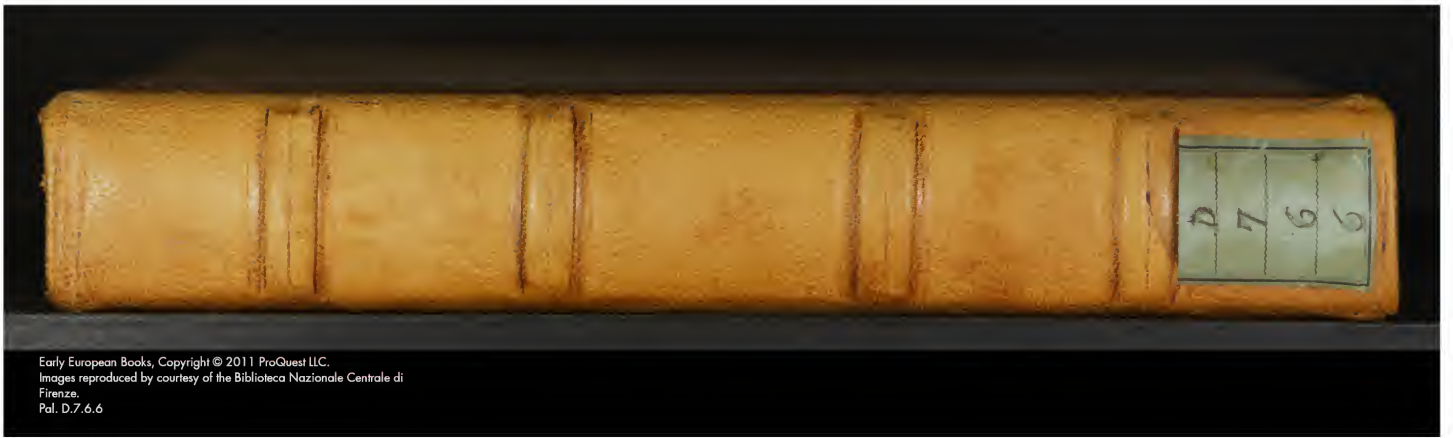
Early European Books, Copyright © 2011 ProQuest LLC. Images reproduced by courtesy of the Biblioteca Nazionale Centrale di Firenze. Pal. D.7.6.6