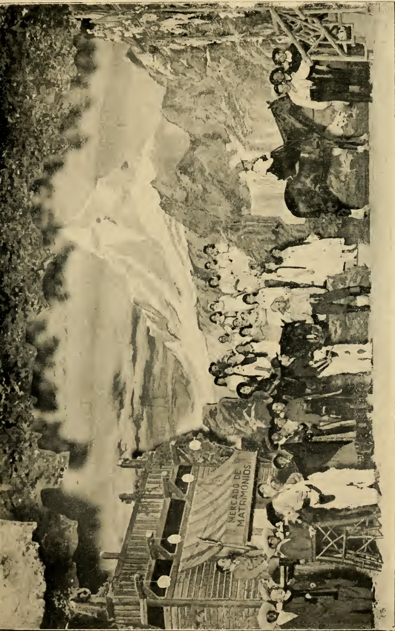
FINAL DEL ACTO PRIMERO