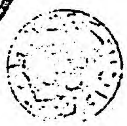
صورة من الغلاف نسخة (ح)