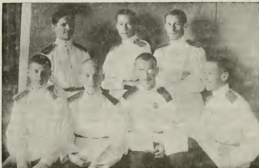
Крымский Кад. Корпус. 1924/25 учебный год. 5-й вып.