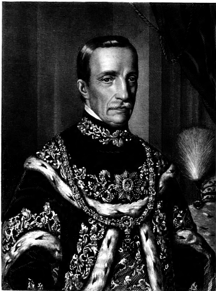
Barabás Miklós rajz