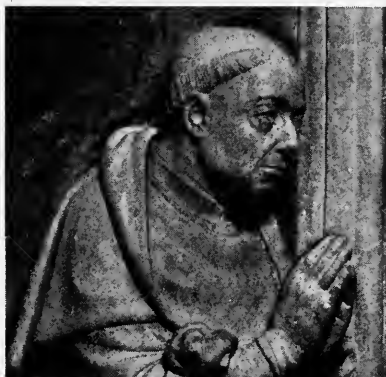
Nicolas de Cues. (D'après un bas-relief de l'église Saint-Pierre-aux-Liens de Rome).

taux, on s'en flattait, prêteraient l'oreille à ces ouvertures, et la majorité bâloise, gagnée de vitesse, jouée artificieusement, punie aussi, il faut bien le dire, de sa fatuité et de son manque de foi, reconnaîtrait, trop tard, l'inanité de ses efforts, serait réduite à avouer sa honteuse défaite. Ce serait, vraisemblable-