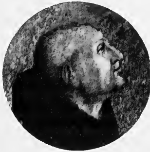
Le cardinal Jean de Torquemada. Tableau d'Antonazzo Romano. (Église de la Minerve, à Rome.)

gène IV 1 , il avait apporté sa foi en la suprématie conciliaire 2 ; il l'avait conservée à Florence 3 , et l'on s'imagine sans peine l'ardeur qu'il mit à la défendre, quand il en eut reçu l'ordre du souverain pontife. Il soutint que la proposition bâloise et le décret de 1415 étaient connexes, qu'on ne pouvait condamner