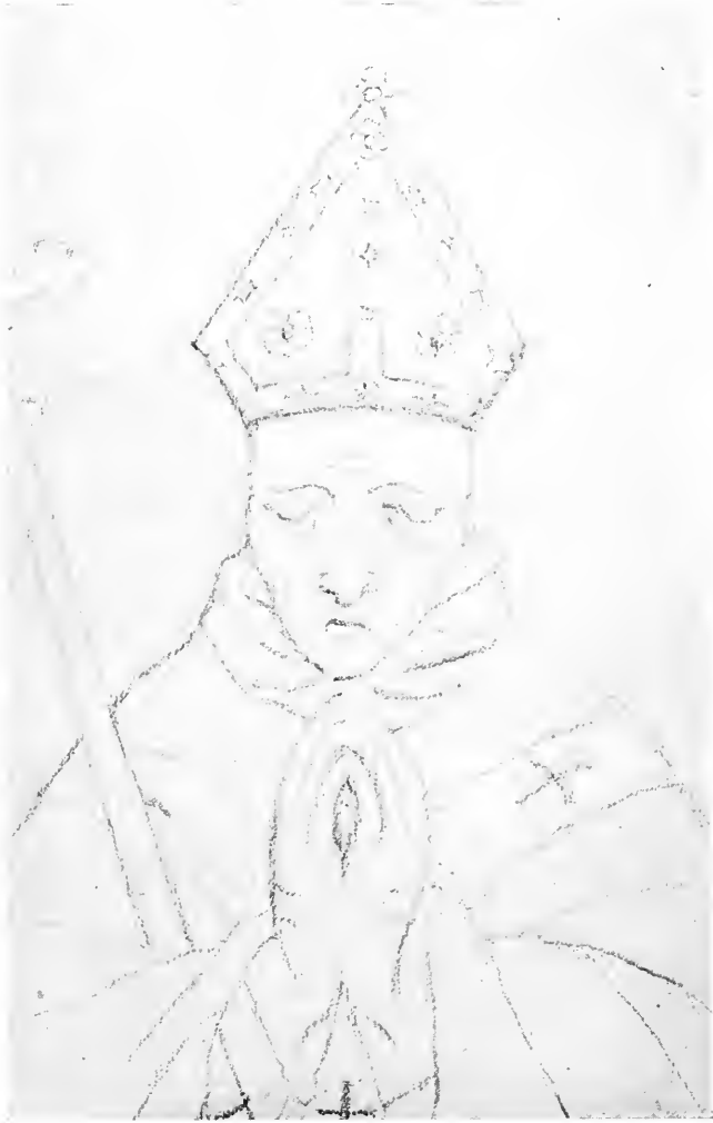
Pierre tombale du cardinal Louis Aleman. (Église Saint-Trophime d'Arles.)