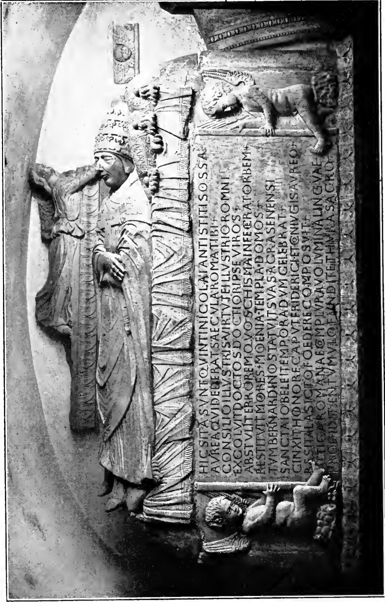
Tombeau de Nicolas V. (Grotte Vaticane.)