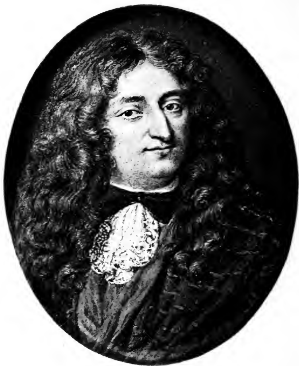
La Fontaine Reproduction d'un émail Conservé au Musée du Louvre