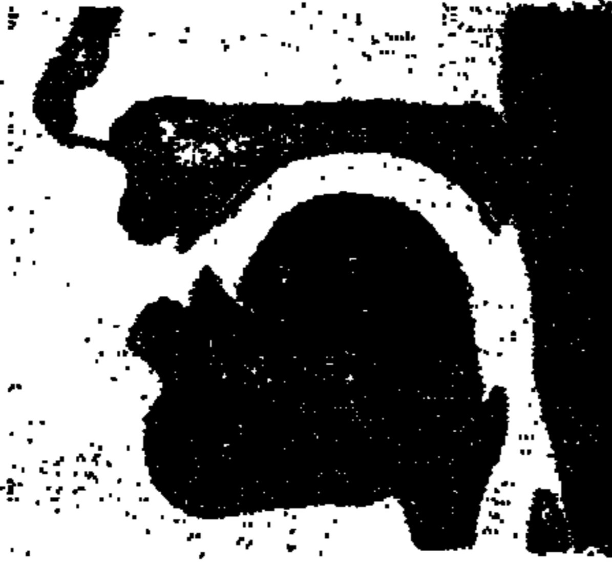
(شكل ٢) الكسر