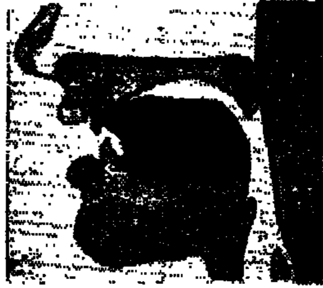
( شکل ۳ )