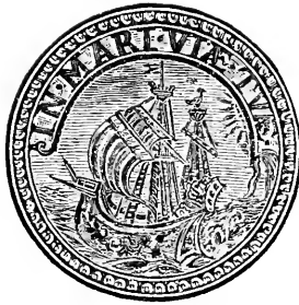
Revers du double-scel de la C e de la Nouvelle France