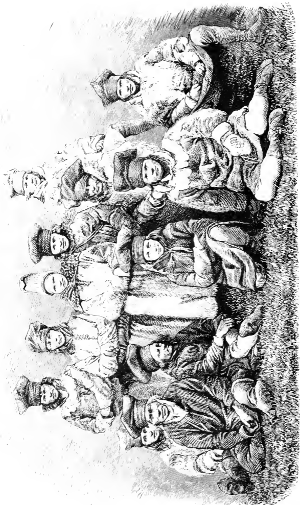
Fjeldlapper fra Karasjok.