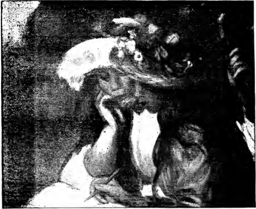
JEUNES FILLES DESSINANT

mignons chapeaux, croquis de couleur, aux compositions colossales, aucune ne le démentira. Mais il faut un effort et le plaisir, même sans l'ivresse, en détourne, pour distinguer l'objet qu'un tel maître, en qui subsiste quelque chose de l'apprenti peintre sur porcelaine qu'il fut moins d'un an, se propose, objet, qui, depuis qu'il travaille, n'a pas varié : obtenir une palette, victorieuse mais ingénue, dont la magie fasse durer éternellement les spectacles de sa prédilection.