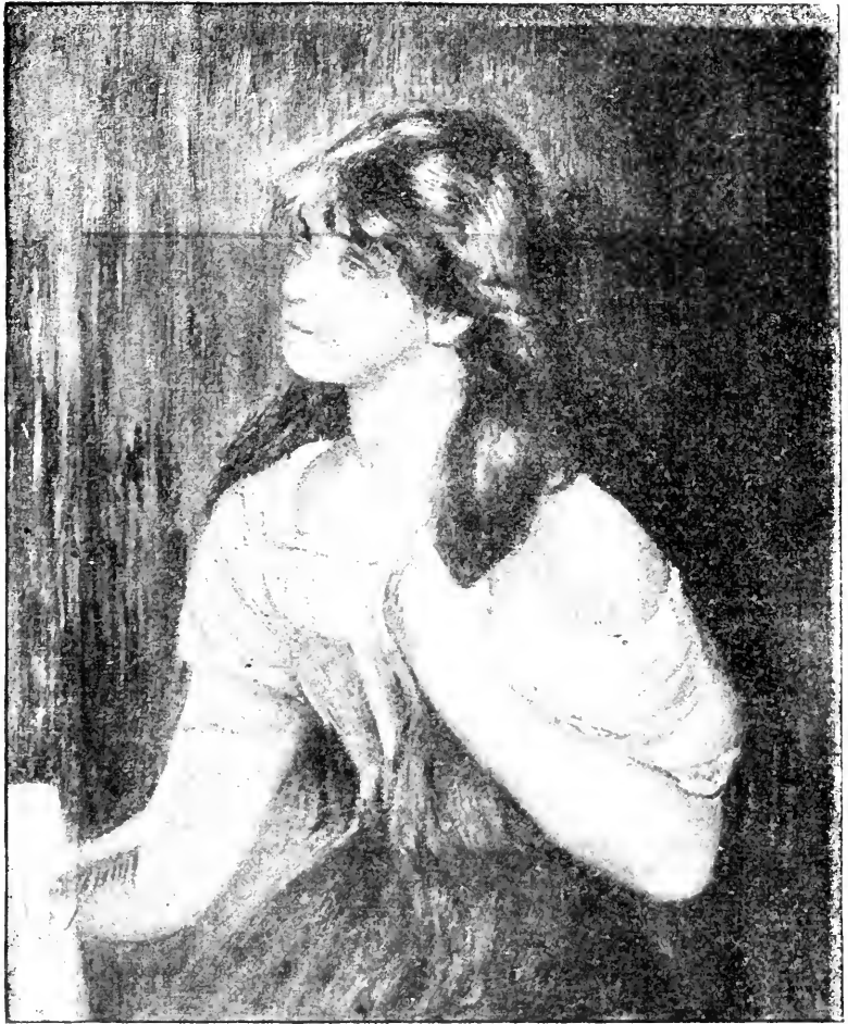
JEUNE FILLE A SA TOILETTE

loppant le même thème, le renouvelant, mais témoignant cette fois d'un désir nouveau, plus personnel, d'élégante écriture aiguë des profils, du souci d'inscrire dans un cadre qu'elles emplissent des arabesques précieuses qui s'enveloppent, non moins d'y faire vibrer des sonorités stridentes, une salle où vivent des enfants, et, auprès, dans sa somptuosité le Bain : les corps nus de femmes jouent parmi l'eau et un paysage, la magnificence du décor n'est pas le moindre prodige : les pinceaux voluptueusement, ont brouillé, assoupli comme un mol oreiller où s'appuyât la grâce, de matière inaltérable, des chairs tendres, les arêtes, on dirait gravées, de leur émail.