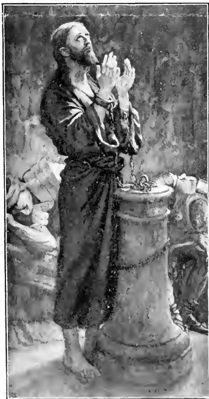
JESUS IN PRISON

G EORGE N. MORANG & COMPANY, Limited, beg to announce that they have made arrangements for issuing a limited edition of this great work, especially for Canada, to be sold by subscription. Nothing approaching this work has ever been attempted before. In the series of splendid pictures, most of them in color, every recorded incident in the life of Christ is presented, every parable is illustrated, every scene of His youth, ministry, death and resurrection is depicted, true in color, costume, landscape and all details to the life, country and the time.