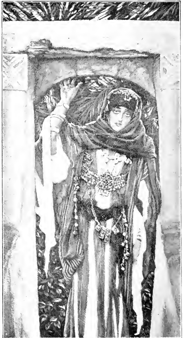
MARY MAGDALENE BEFORE HER CONVERSION

In 1894, Tissot exhibited at the Champ-de-Mars Salon, the paintings then completed. The exhibition was extraordinary for the unusual enthusiasm it aroused not only among the art critics and amateurs but among the great crowds of people of all classes that gathered day after day as long as the pictures were on exhibition. It would be difficult for those who did not see with their own eyes the remarkable scenes that took place daily in the Salon, to realize that the