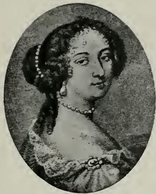
Mme DE MAINTENON