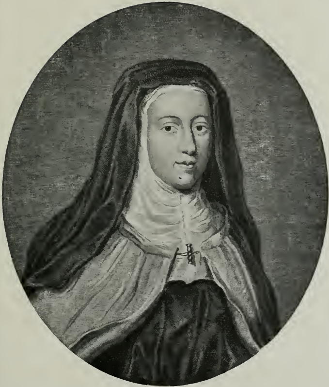
Sœur LOUISE DE LA MISÉRICORDE (M lle DE LA VALLIÈRE, au couvent)