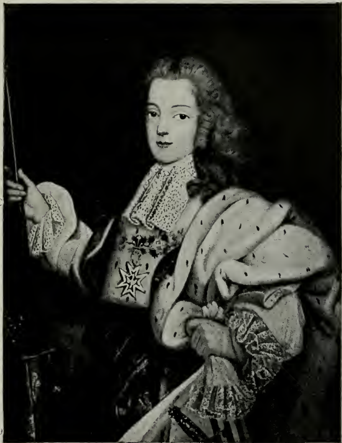
LOUIS XV, enfant (Musée du Château de Blois)