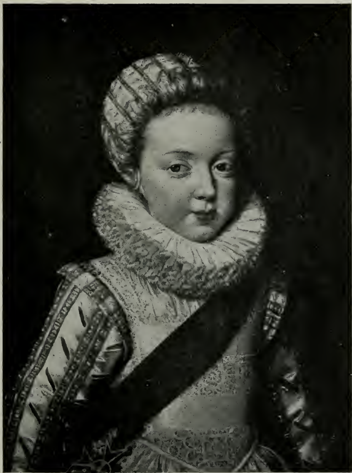
LOUIS XIII, enfant.