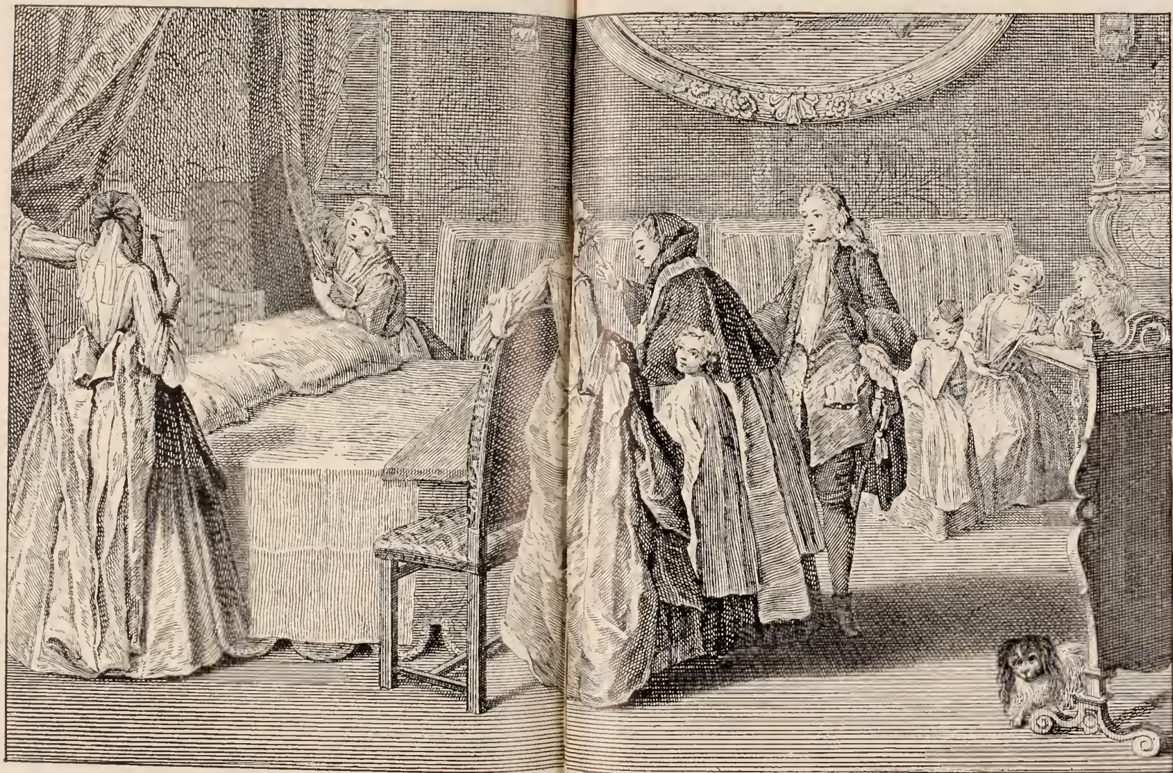
LA BÉNÉDICTION DU LIT NUPTIAL