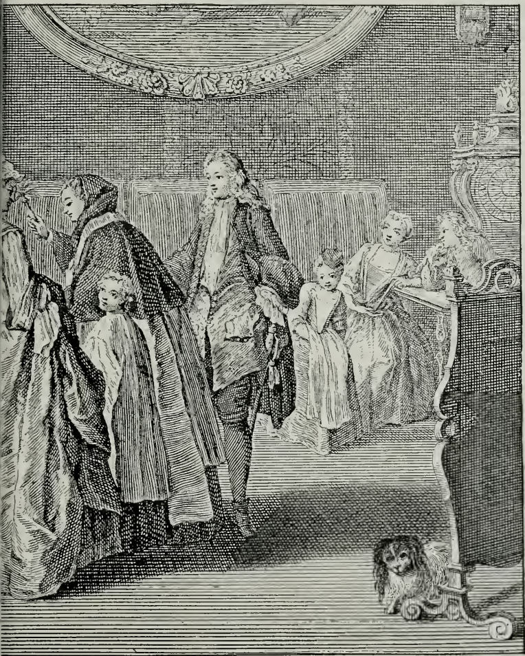
DU LIT NUPTIAL