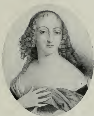
Mlle DE LA VALLIÈRE