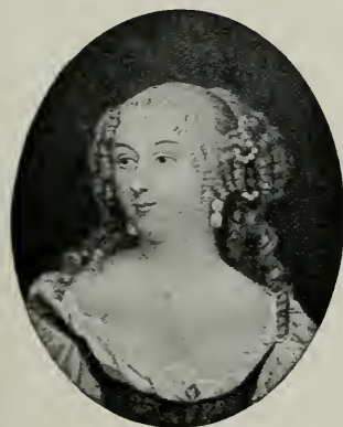
Mme DE MONTESPAN