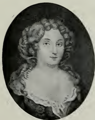
Mlle DE FONTANGES