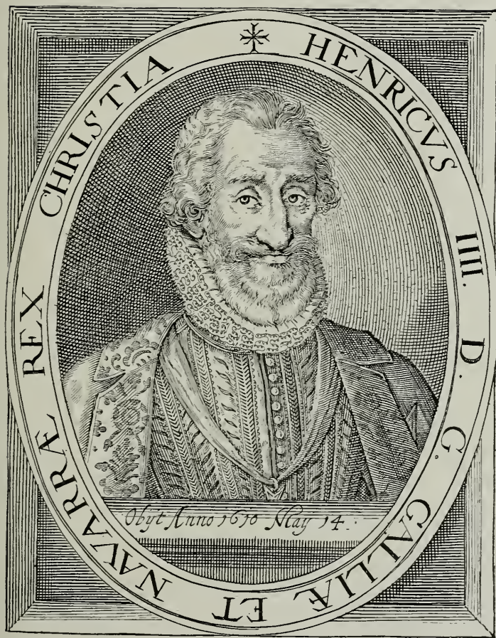
Henrick de III. Coninc van Francyck en Navarre H. Jacobsen, excud.