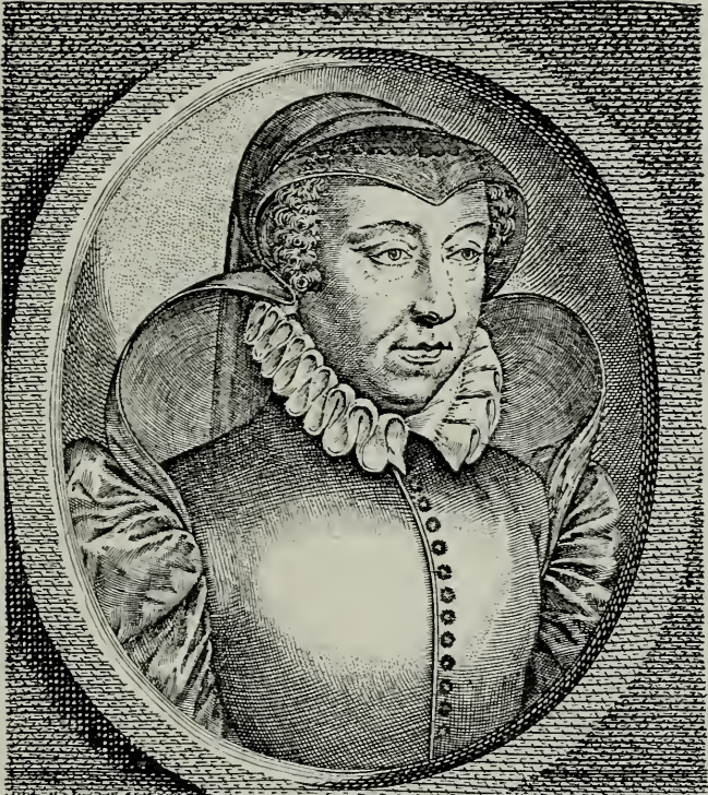
CATHERINE DE MEDICIS, Reine de France, Morte à Blois le 5. janvier 1579. âgée de 70 ans.