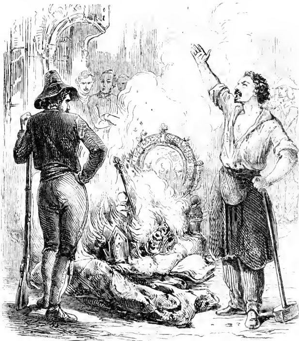
Les dépositaires de la puissance exécutive ne sont point les maîtres du peuple. — PAGE 17.

On peut remédier par des moyens semblables à l'inconvénient opposé, et, quand le gouvernement est trop lâche, ériger des tribunaux pour le