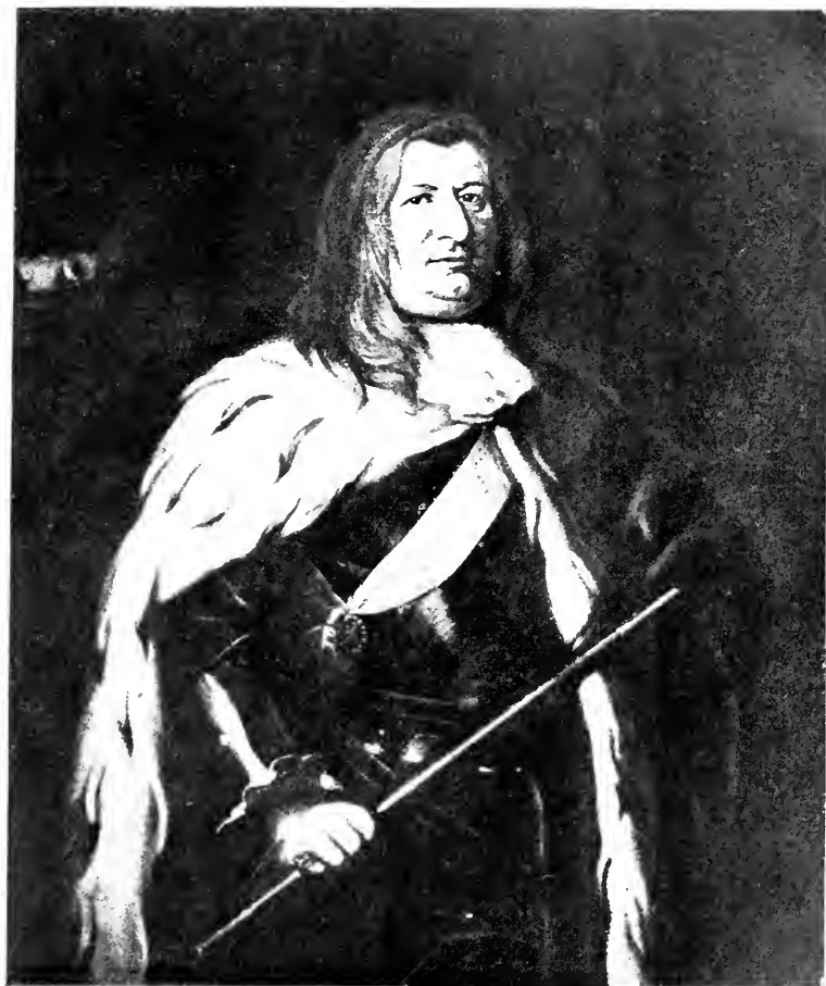
LE GRAND ELECTEUR VERS 1675