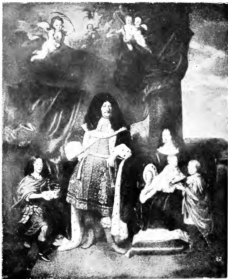
LE GRAND ELECTEUR, SA PREMIÈRE FEMME ET LEURS ENFANTS 1666 D'APRES DANIEL MYSIENS