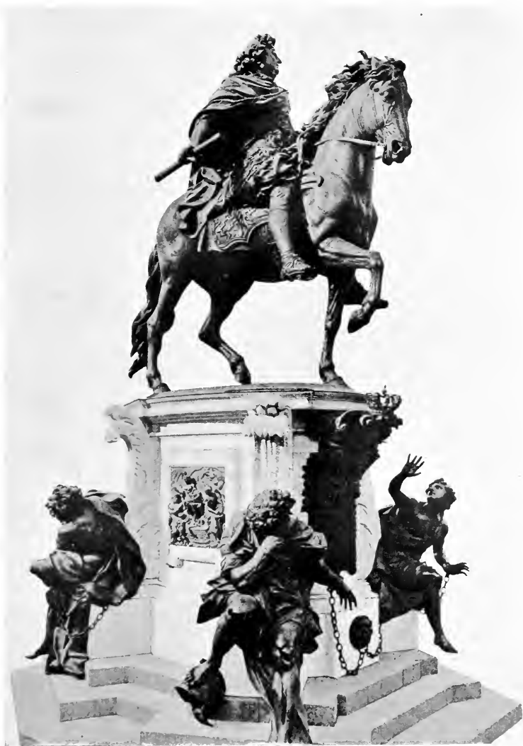
MONUMENT DU GRAND ÉLECTEUR, A BERLIN