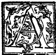
TAVOLA DELLE COSE piu notabili, che nella presente Opera si contengono.

A CQVA che copiosa uenga dalla matrice cura alcuna infusione. 318.1. supposito- rio. 1. empiastro 1. Alipsa muscata come si com- ponga, & quali siano le sue