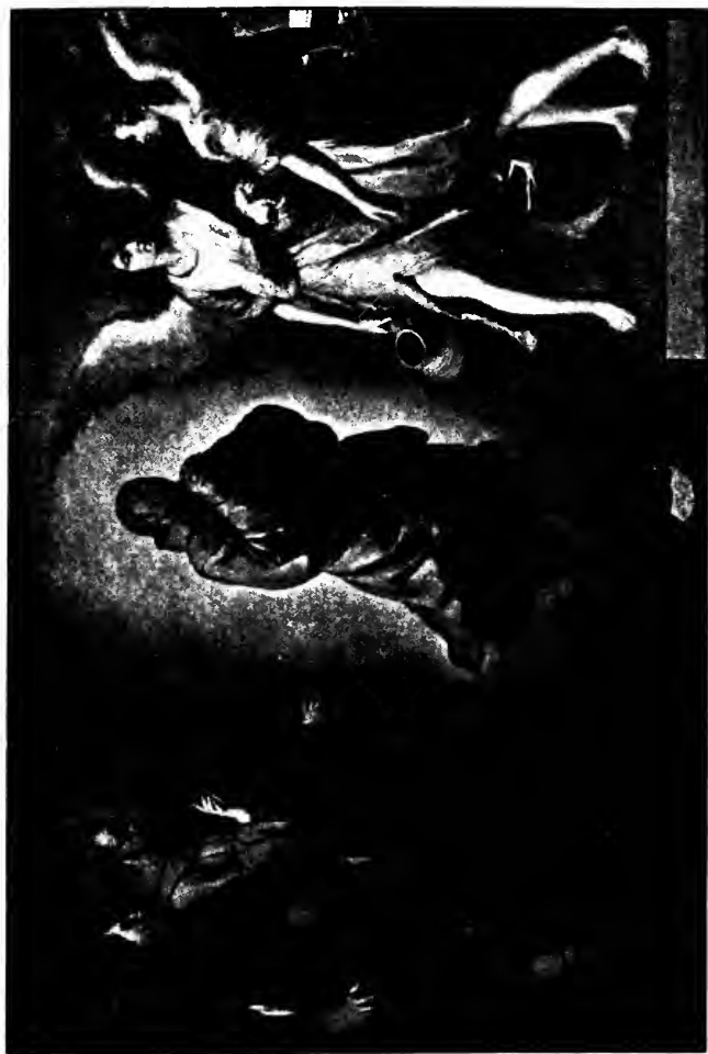
LÉVITATION DE SAN DIÉGO (d'après MURILLO)