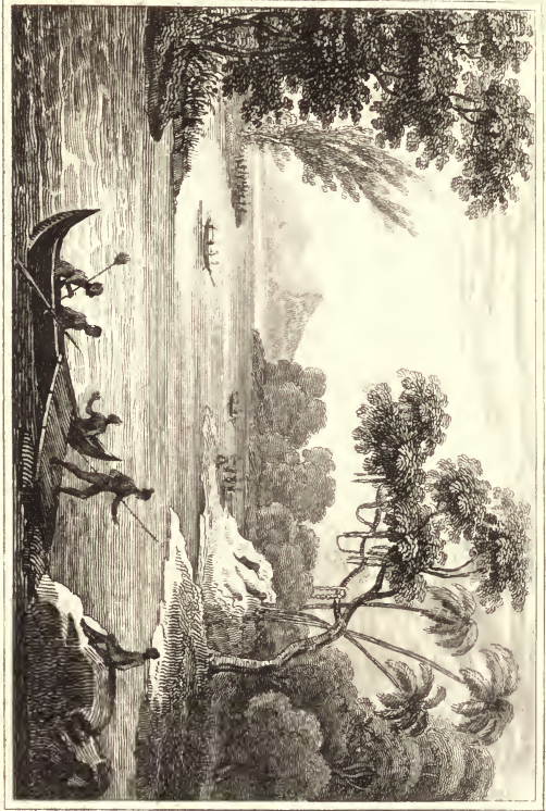
Les Indes Néerlandaises (Sumatra).