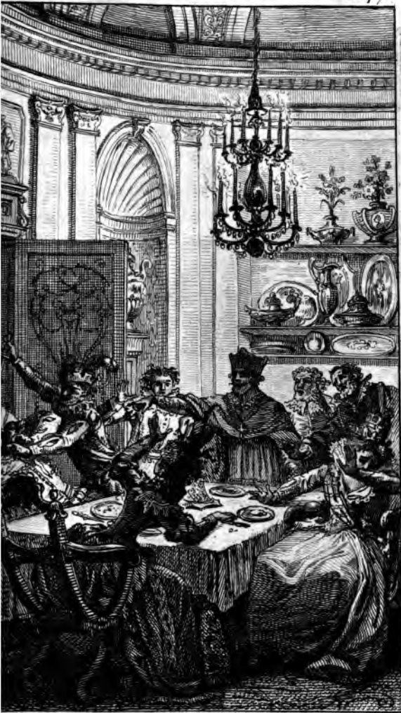
Borgia, cardinal, fils d'Alexandre VI, fait assassiner le duc de Cambrie e aîné, dans une orgie où assistoient leur mere et leur sœur.