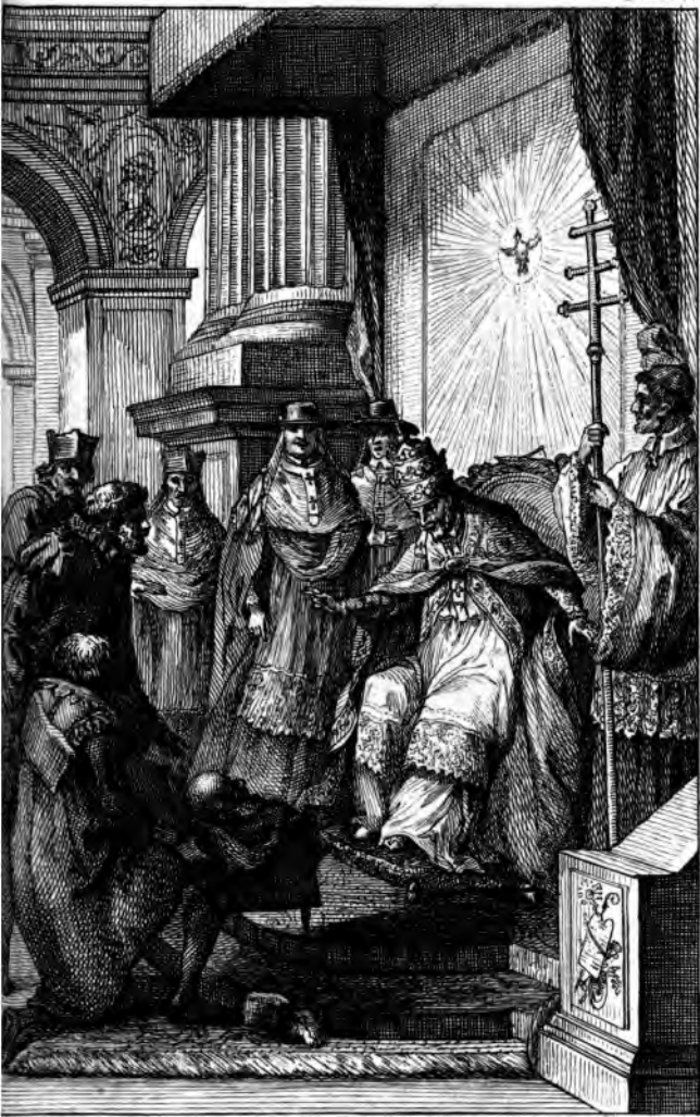
Grégoire XIII reçoit la tête de l'Amiral Coligny que lui envoie Catherine de Médicis