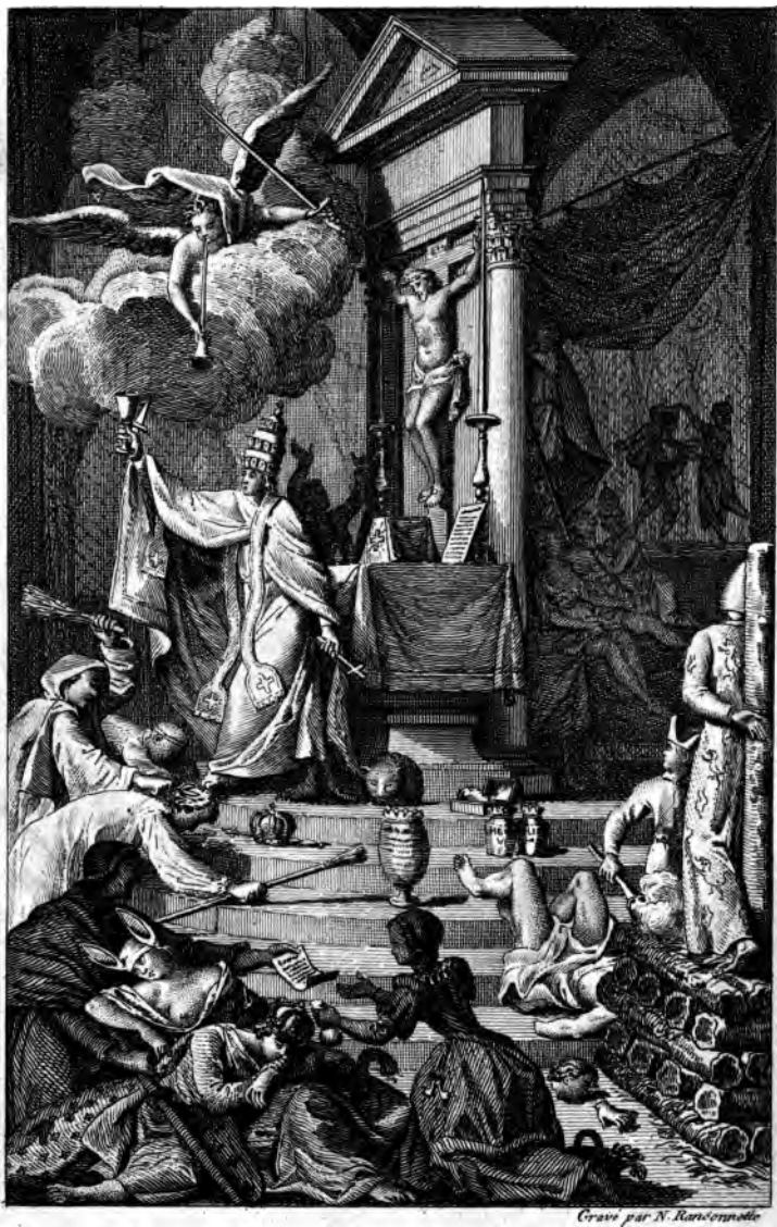
Crimes des Papes .