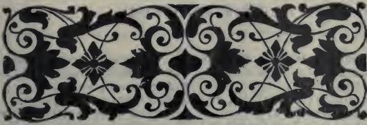
TABLE DES NOMS

Philosophes. — Auteurs. — Savants. — Artistes. — Personnages du xvi e siècle. — Lieux que Montaigne a vus.