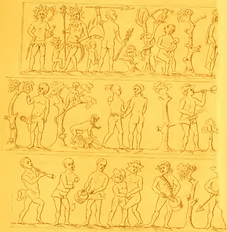
BAS RELIEF DE L'ÉGLISE DE S