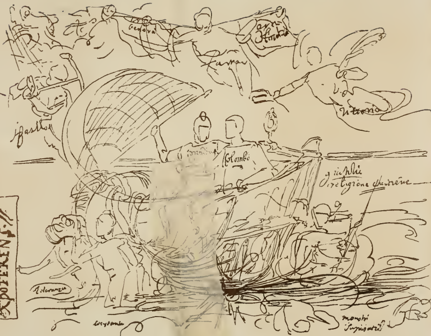
Fac-Simile d'un dessin par Adm. d'un tableau de Christophe Colomb.