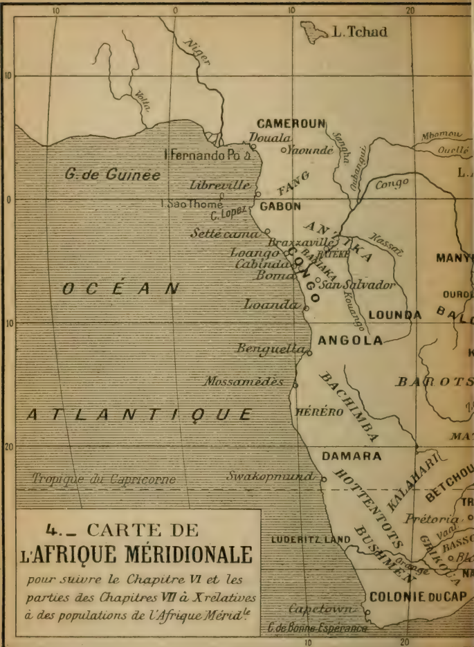
4. - CARTE DE L'AFRIQUE MÉRIDIIONALE pour suivre le Chapitre VI et les parties des Chapitres VII à X relatives à des populations de l'Afrique Méridionale