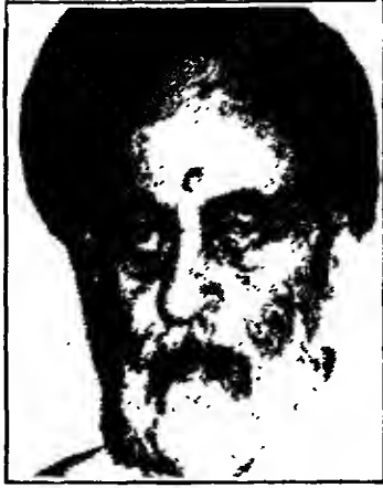
العلامة الكبير السيد محمد حسين الطباطبائي

في الثامن عشر من شهر محرم الحرام عام ١٤٠٢ هـ ، لَبَّى العلامة الكبير السيد محمد حسن الطباطبائي نداء ربّه ، والتحق بالرفيق الأعلى بعد أن قضى عمره المبارك في انتحال العلوم الإسلامية وتطويرها وإثرائها .