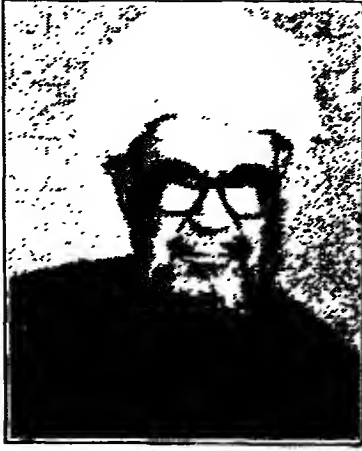
العلامة الشيخ أحمد النجفي مؤسس معهد دار العلوم العربية بتهران

الشيخ أحمد النجفي هو ابن المرحوم الشيخ مهدي وحفيد الشيخ أسد الله التستري ثم الكاظميني (أحد كبار العلماء الأعلام في القرن الثالث عشر للهجرة ومؤلف كتاب «مقابس الأنوار»). كان رجل دين وعلم وسياسة ، ولد عام ١٩٠١ ميلادية في النجف الأشرف ، وأدت نشاطاته الدينية والسياسية في العراق إلى ثورة «الرُمَيْثَة» (عام ١٩٣٥ م) ، وبعد عدة سنوات نفته الحكومة العراقية للمرة الثانية إلى إيران (عام ١٩٤٠ م) فاستوطن طهران منذ ذلك الحين حتى وفاته عام ١٩٧٤ م .