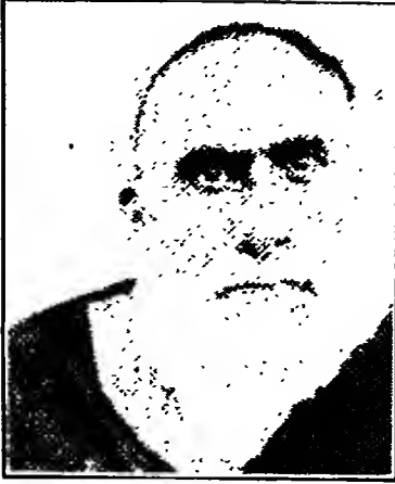
ثقة المحدثين الشيخ عباس القمي (١٢٩٤-١٣٥٩ هـ)

هو الحبر النحرير ، والعالم البصير ، والمحدث الخبير ، الشيخ عباس بن محمد رضا بن أبي القاسم القمي عالم عامل ثقة عدل متبع بحاثة عصره أمين مهذب زاهد عابد . من أفاضل علماء العصر الحاضر ، ولد في سنة ١٢٩٤ هـ ببلدة قم ونشأ فيها ، واشتغل بالتعليم إلى أوان سنة ١٣١٦ هـ . ففيها هاجر إلى العراق لتكميل تحصيلاته ، فقدم النجف والتزم مصاحبة أستاذه في الحديث والرجال العلامة النوري (الحاج ميرزا حسين الطبرسي) وأخذ منه الحديث والرجال ، فبرع فيهما ، وأجازه أستاذه العلامة ، وكان اجتماعه به في سنة ١٣١٤ هـ ، وذلك بعد مهاجرة العلامة المذكور من سامراء إلى النجف بسنتين ، فاستفاد منه بقية حياته ، وعاضده في تأليفه ، حتى قبض شيخه في سنة ١٣٢٠ هـ ، فرجع جنابه إلى موطنه الأصلي (بلدة قم) وبقي هناك مستقلاً بالبحث والتنقيب . فأفاد بدرسه وتأليفه . وفي عام ١٣٢٢ هـ هاجر إلى خراسان وتشرف بمشهد مولانا الرضا واستوطنه ؛ وبقي إلى أواخر عمره في ذلك المشهد الشريف . . ولم يزل في أثناء إقامته بهذه البلدة مشغلاً بالإفادة : تدريساً وإلقاءً في منابرها ، وكتابةً في مؤلفاته ، حتى أن جمعاً من محصلي العلوم الدينية طلبوا منه تدريس الأخلاق ، فقبل جنابه ، وكان يلقي دروسه الأخلاقية في