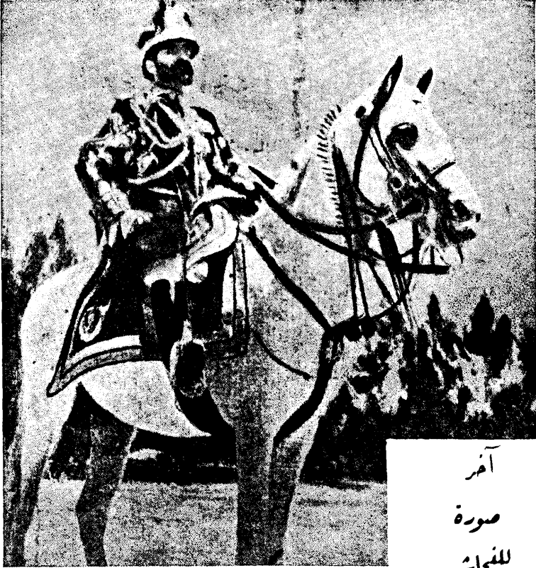
آمر صورة للنجاشي

نجاشي الحبشة على جواده الابيض في حفلة استعراض عسكري قبل ان يلقى تصريحه الدولي الخطير في مجلس النواب الحبشي