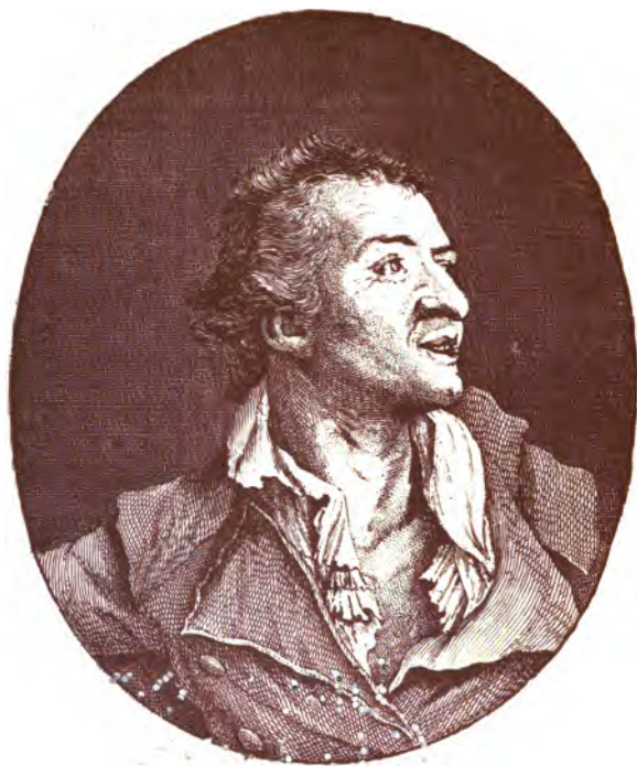
J. P. MARAT.