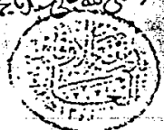
اللوحه الأخيرة من النسخة المكية «أ»

تم جميع المشتهر مسند الموطا والحمد لله رب العالمين وانفق الفراع من ستاخنة يوم الاجر الخامس والبعشر من شهر ربيع الاول احدى شهرين سنة ثمان وتسعين وستمائة وصلى الله على سيدنا محمد واله وسلم