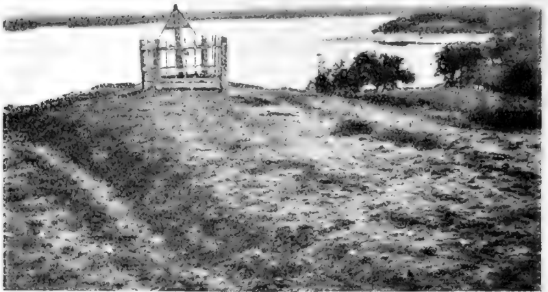
Рис. 10. Р. Буря бл. Осташна.

Слѣдующее селеніе, станица Винникова, въ которомъ старожильческихъ казачьихъ домовъ всего три, остальные новоселы. Ст. Винникова расположена на правомъ берегу той же р. Райчихи, на краю высокой террасы.