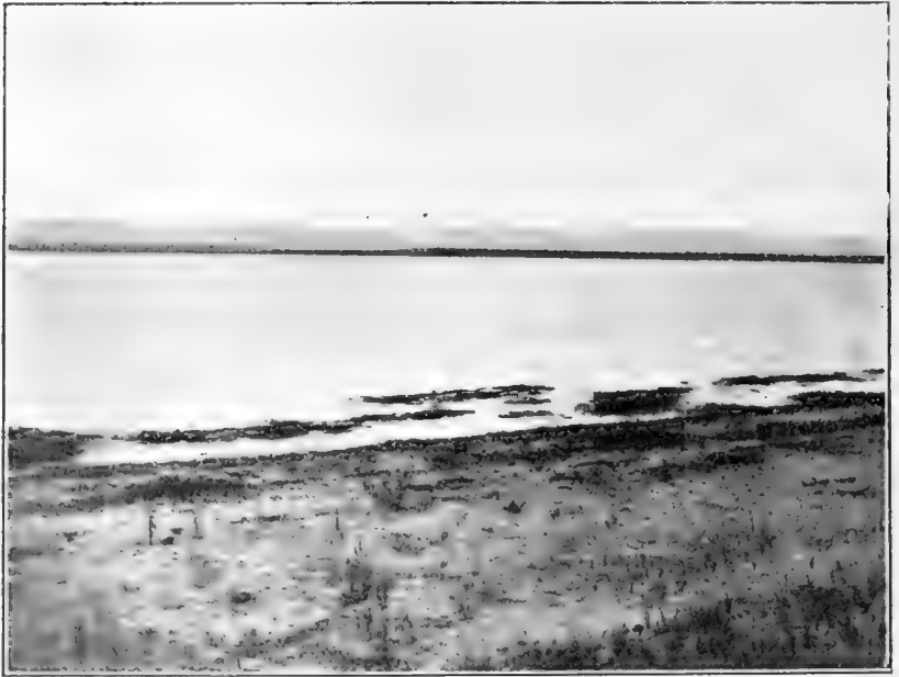
Рис. 3. Озеро Кенонь.

Березовая полоса озера неширока и почти лишена растительности (см. рис. 3).