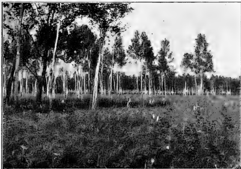
Рис. 12. Березовые лѣса бл. ст. Петровской.

На прилагаемомъ рисункѣ (см. рис. 12) видно насажденіе бѣлой березы, съ примѣсью черной березы, а на луговинѣ спереди изобиліе Actaea simplex .