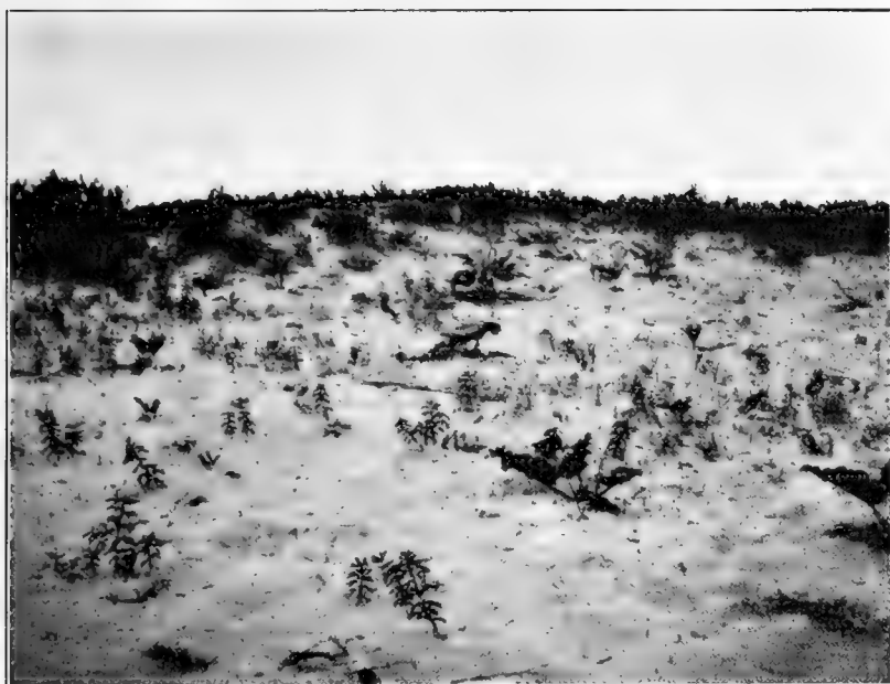
Рис. 2 Rheum undulatum близъ озера Кенонъ.

Травянистая растительность этихъ дюнь также довольно разнообразна. Наиболее богата по числу различныхъ представителей флоры полоса, переходная къ описанной выше степи. Наиболее характерны всхолмленные участки голаго песка, на которомъ пріютились крупныя Rheum undulatum (см. рис. 2 ) среди которыхъ замѣтны менѣе крупныя растенія. Этотъ видъ ревеня является особенно характернымъ для песковъ Забайкалья. Тѣмъ интереснѣе, что въ культурѣ