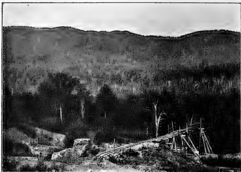
Рис. 15. Общій видъ тайги на горахъ Хехцырь бл. ст. Корфовой.

Для личнаго ознакомленія съ лѣсной флорой низовьевъ Уссури я предпринялъ экскурсію на ст. Корфовскую, гдѣ имѣлъ возможность видѣть лѣса по склонамъ хребта Хехцырь. Во время этой поѣздки работѣ сильно мѣшали дожди, почему и пришлось тамъ ограничиться двумя лишь экскурсіями.