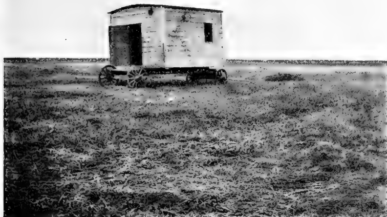
Рис. 9. Фургонъ въ поляхъ.

Изъ села Райчихи мы направились вдоль долины р. Райчихи къ д. Винниковой. Рѣку сопровождаетъ узкая полоса прибрежныхъ кустарниковъ и большая часть долины занята луговой формаціей. Склонъ долины мѣстами занятъ кустарниками, среди которыхъ замѣченъ и Quercus mongolica . Далѣе мы нѣсколько удаляемся отъ рѣки и ѣдемъ по „сырой степи“, гдѣ во многихъ мѣстахъ виднѣются за-