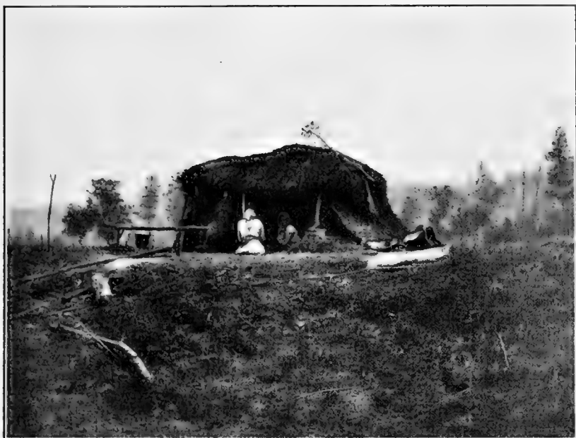
Рис. 7. Косцы на р. Шилкѣ.

правый берег Шилки представляет наоборотъ луговую террасу которая стала перѣдки ниже Усть-Черной. Здѣсь по берегу развита полоса пввяковъ, въ которой мы отмѣтили: Salix triandra , Ulmus campestris . Выше идетъ собственно лугъ, который представляетъ нѣсколько терасъ. Большая часть луга была уже скошена (см. рис. 7). Намъ удалось отмѣтить здѣсь Thalictrum simplex , Adenophora denticulata , Adenophora latifolia , Viola Gmeliniana , Tanacetum boreale , Galium boreale ,