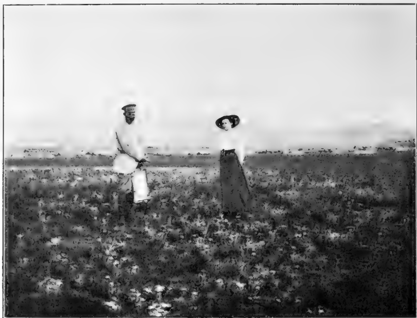
Рис. 1. Степь близъ озера Кенонъ.

Утромъ 2 августа мы предприняли экскурсію для ознакомленія со степной растительностью окрестностей Читы. Мы направились по жел. дор. до ст. Чита I., а оттуда пошли степью по направленію къ озеру Кенонъ.