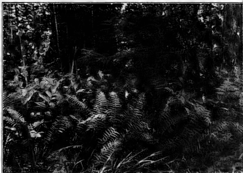
Рис. 16. Nephrodium thelypteris и Smilacina daurica бл. ст. Корфовской.