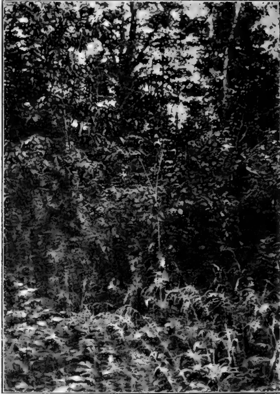
Рис. 17. Тайга бл. ст. Корфовской ( Serratula atriplicifolia , Syringa amurensis и пр).

Изъ мховъ Sphagnum (мѣстами, въ незначительномъ количествѣ), Hylacomium , Catharinea (на вывороченныхъ пняхъ), два мха на стволѣ осины, на упавшей пихтѣ, изъ лишайниковъ Cladonia .