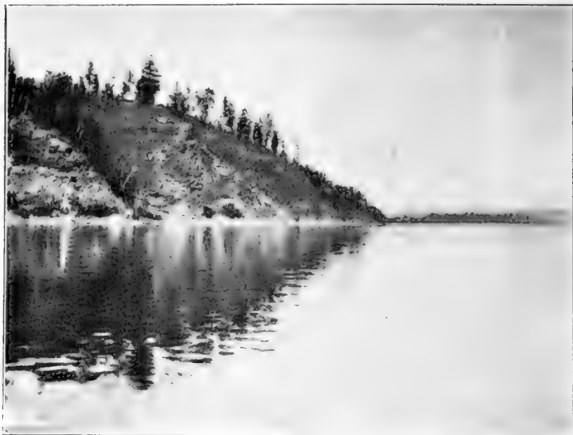
Рис. 6. Сосновый лѣсъ на р. Шилкѣ.

Ниже сел. Усть-Черной въ долину Шилки выходитъ „временка“, колесная дорога, устроенная по случаю по-