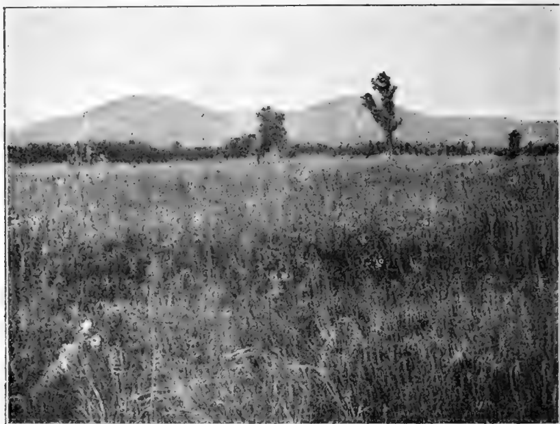
Рис. 11. Между ст. Даурь и Солонечная.

Отъ ст. Даурь дорога сейчасъ же идетъ въ гору — начинается подъемъ къ перевалу чрезъ невысокій хребетъ. Подъемъ идетъ сначала вдоль лога съ луговой растительностью, горные же склоны поросли дубовымъ лѣсомъ. Самый