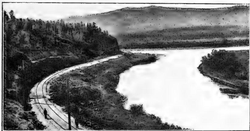
Рис. 4. Устье р. Читы.

Изъ города Читы мы выѣхали утромъ 3 августа. До станціи Кручина желѣзная дорога идетъ долиной р. Читы до