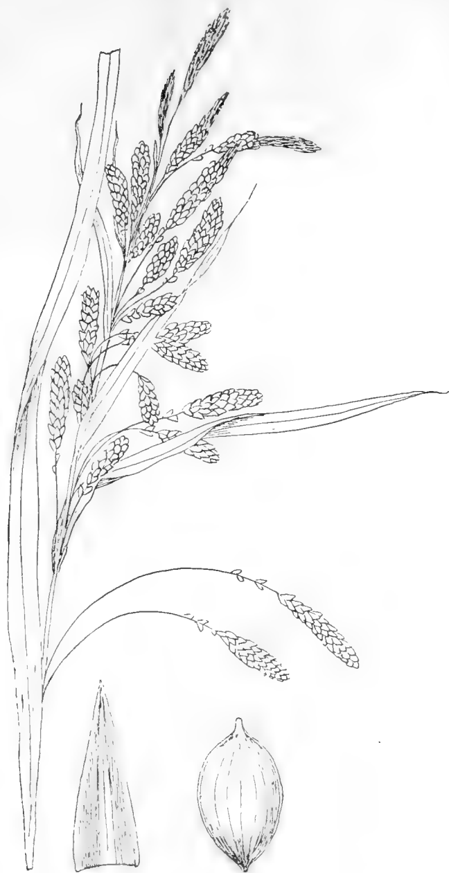
Рис. 27. Carex tuminensis Komar.