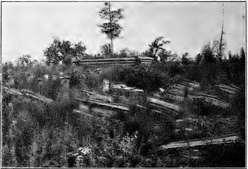
Рис. 24. Пасѣка въ поселкѣ Дьяченко.

Во Владивостокъ пришлось пробыть недолго, причемъ главное вниманіе было мной посвящено интереснымъ ботаническимъ коллекціямъ Музея Общества Изученія Амурскаго Края.