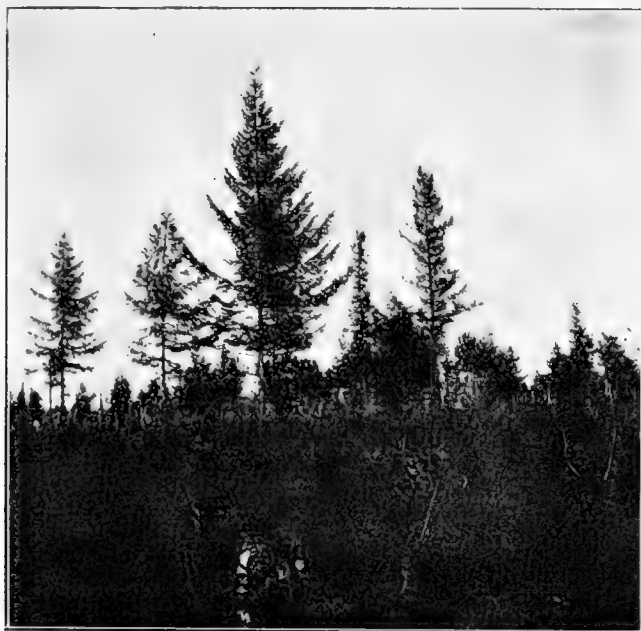
Рис. 18. Larix daurica бл. с. Тронцаго.

Интересными являются отношенія между тѣмъ болотомъ и упомянутымъ лѣсомъ. Я не вижу въ данномъ случаѣ никакихъ признаковъ заболачиванія лѣса и потому полагалъ бы, что при вырубкѣ лѣса и болото можетъ осушиться.