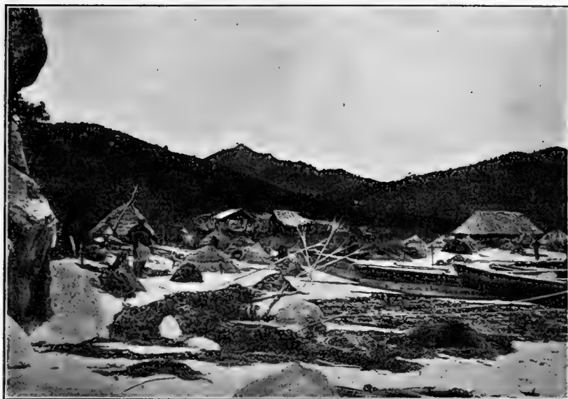
Рис. 25. Добываніе „морской капусты“ бл. Владивостока.

Поднявшись нѣсколько надъ полотномъ ж. д., пролегающимъ почти у самого уровня моря, мы стали продолжать свой путь по тропѣ, ведшей насъ къ вершинѣ одной изъ горныхъ грядъ, верстахъ въ трехъ (по прямой линіи) отъ станціи и берега моря.