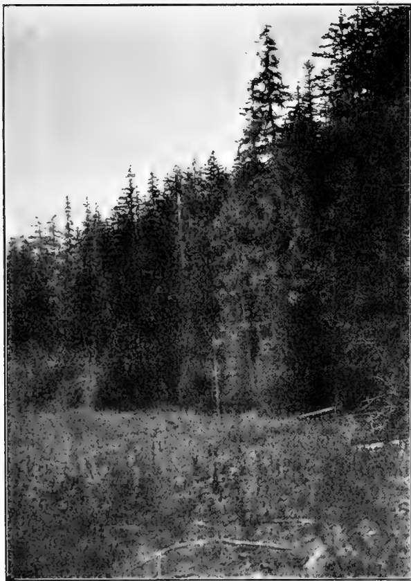
Рис. 22. Тайга изъ аянской ели (спереди луговина вдоль ручья).

Когда было уже совершенно темно, мы принуждены были остановиться на ночлегъ въ тайгѣ, такъ какъ совершенно не знали, куда далѣе идти.