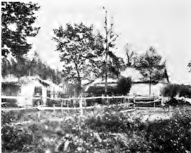
Рис. 13. Сел. Волочаевка.

Въ сел. Волочаевкѣ нѣсколько домовъ брошено новоселами, но часть ихъ занята уже новыми поселщиками (см. рис. 13),