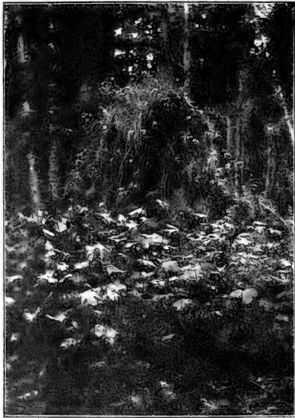
Рис. 23. Тайга на спускѣ къ Патхѣ ( Filipendula kamtschatica , сзади вывороченный корень аянской ели).

Продолжаемъ путь свой по лѣсенному горному склону и выходимъ къ такому мѣсту гдѣ рѣчка становится уже довольно многоводной; это вершина одного изъ притоковъ