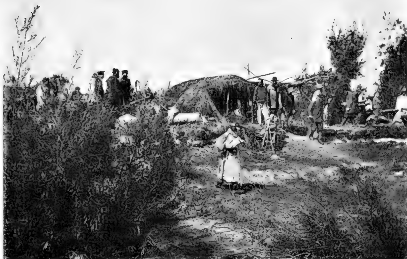
Рис. 14. Пристань на берегу Амура.

Станція Тунгузка расположена на краю большаго поселка Дежнева, въ которомъ между прочимъ находится