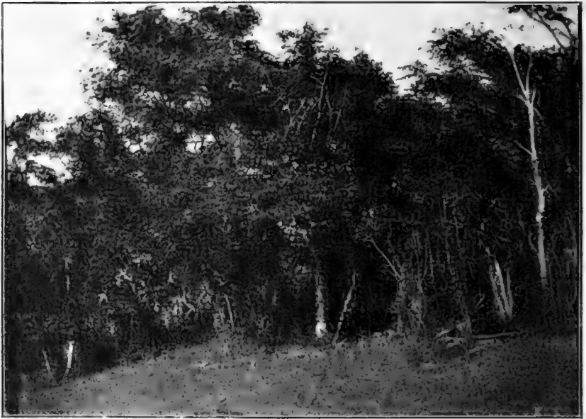
Рис. 19. Phellodendron amurense и Vitis amurensis (бл. Иннокентьевской).

Продолжая свой путь внизъ по Амуру, мы вечеромъ 9 сентября остановились на ночлегъ на песчаномъ правомъ берегу Амурской протоки, среди ивнякаваго лѣса. Господствующей, исключительной породой ивы является здѣсь