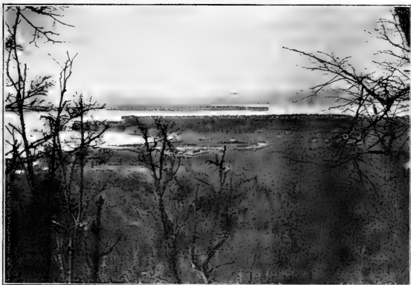
Рис. 26. Видъ съ горы бл. ст. Океанской.

Самая вершина, на которую мы взошли, лѣсиста какъ разъ на ней нѣсколько крупныхъ экземпляровъ Abies holophylla , но тѣмъ не менѣе съ нея открывается хорошій видъ къ морю, причемъ хорошо виденъ полуостровъ Гольденшtedта (см. рис. 26). Въ другую сторону, по просьбѣ, видны верховья Черной рѣчки и горный склонъ за нею, заросшій лѣсомъ, въ которомъ значительно больше кедра