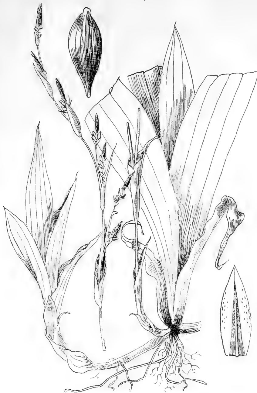
Рис. 28. Carex siderosticta Hance.