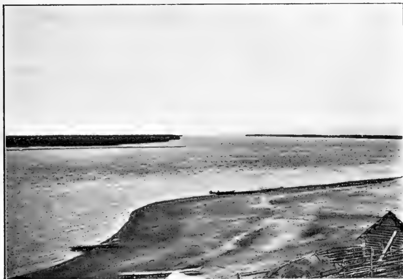
Рис. 20. Р. Амуръ (видъ отъ д. Иннокентьевской).