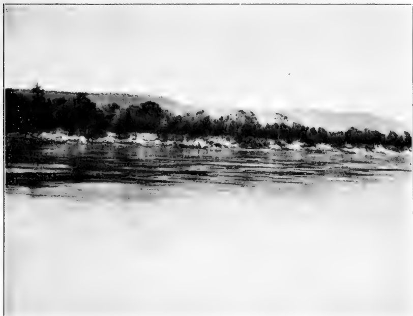
Рис. 5. Уремный лѣсъ близъ Лунженковъ.

Берега Шилки между Усть-Карой и Лунженками довольно крутые, покрыты не старымъ лѣсомъ Betula latifolia ,