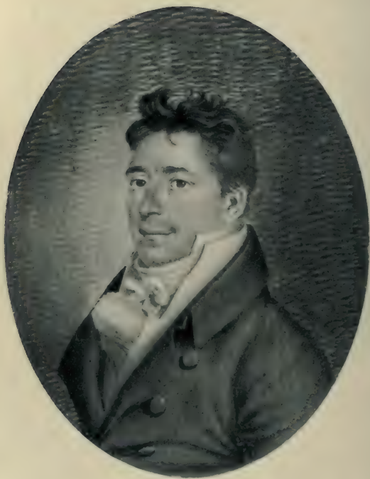
CARL HENRIK HOLTEN Tegning fra ca. 1815.