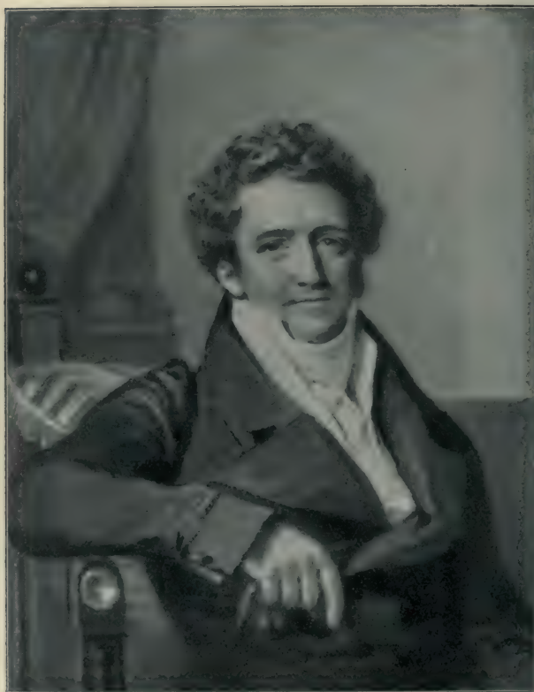
PRINS CHRISTIAN FREDERIK (Christian VIII) Efter Tegning paa Rosenborg (ca. 1830).