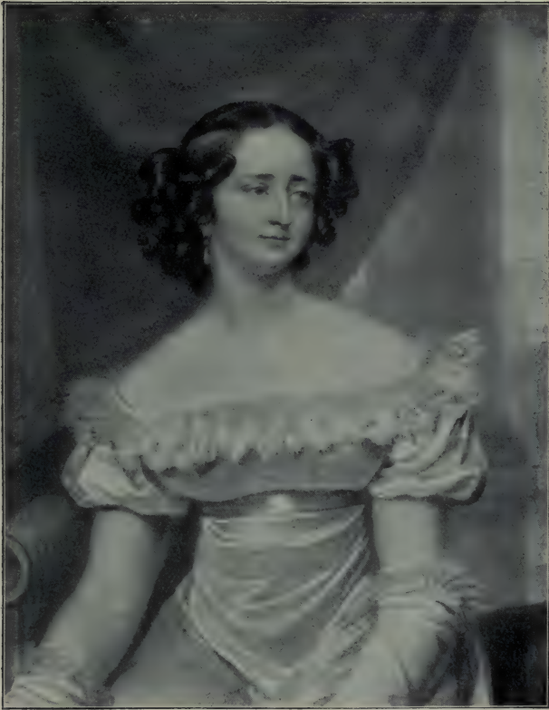
PRINSESSE CAROLINE AMALIE Efter Tegning paa Rosenborg (ca. 1830).