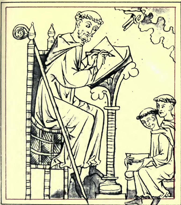
Original title: De consideratione ad Eugenium papam tertiam libri quinque

s'en vait a li et li dist : « Damoiseie, vous en fustes a tort menee de la court et je vous i remenrai a droit, car pour chou m'envoia cha li rois Artus, en cui ostel vous fustes prise. » Et lors le veult prendre par les bras, quant li escuier saillirent sus et disent : « Ha ! biau sire, tel villonie ne ferés vous ja que vous cest[e] damoiseie qui est en nostre garde nous taulliés ; mais faites le bien : vés la deus chevaliers qui le nous baillierent a garder ; faites