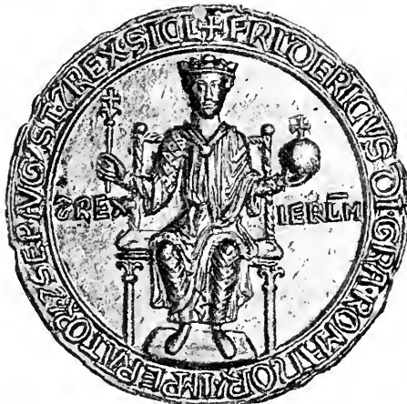
(Von 7,2 auf 5,7 C. verkleinert.)

Die Abkürzungsstriche der Umschrift bestehen in Verdickungen der äusseren Umfassungslinie an