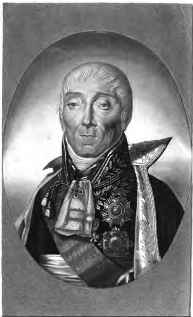
Joseph Fouché, DUC D'OTRANTE, Ministre de la Police Générale.