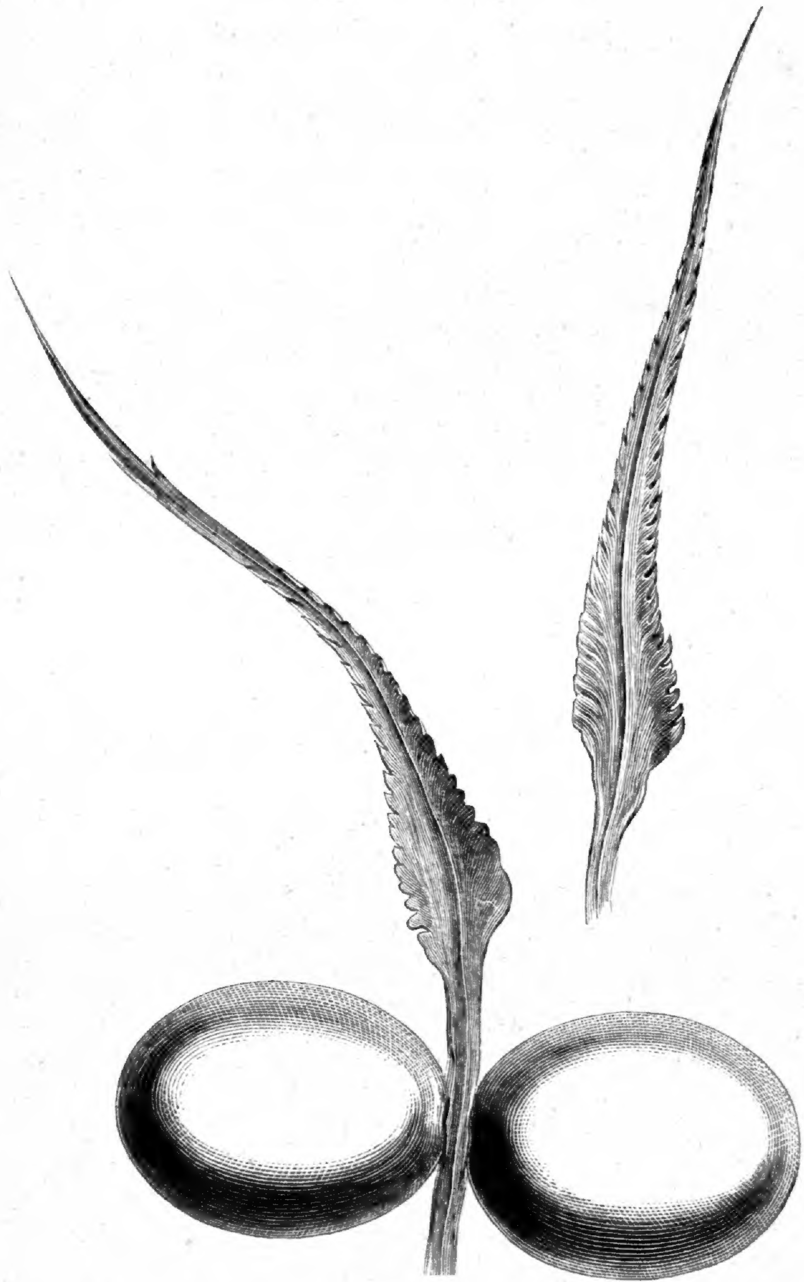
Cycas Normanbyana. F. M.