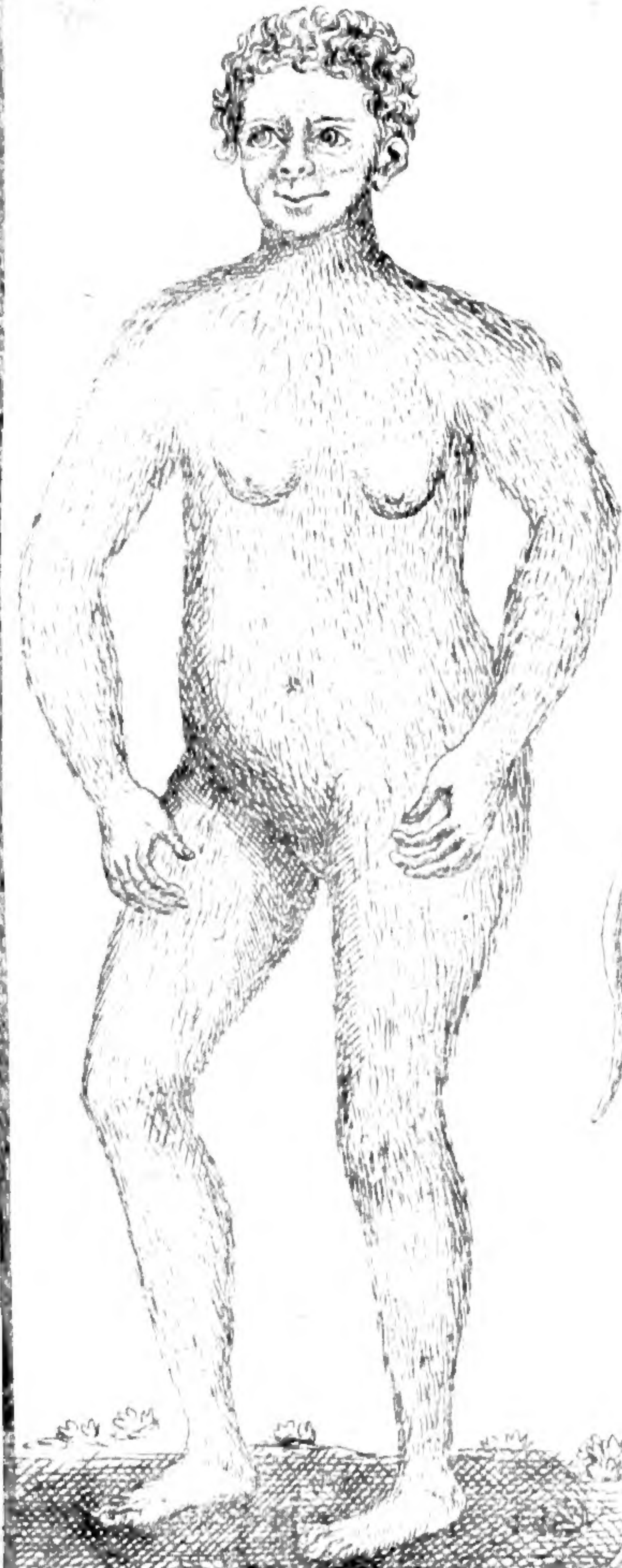
1. TROSCIDYTA Bonta