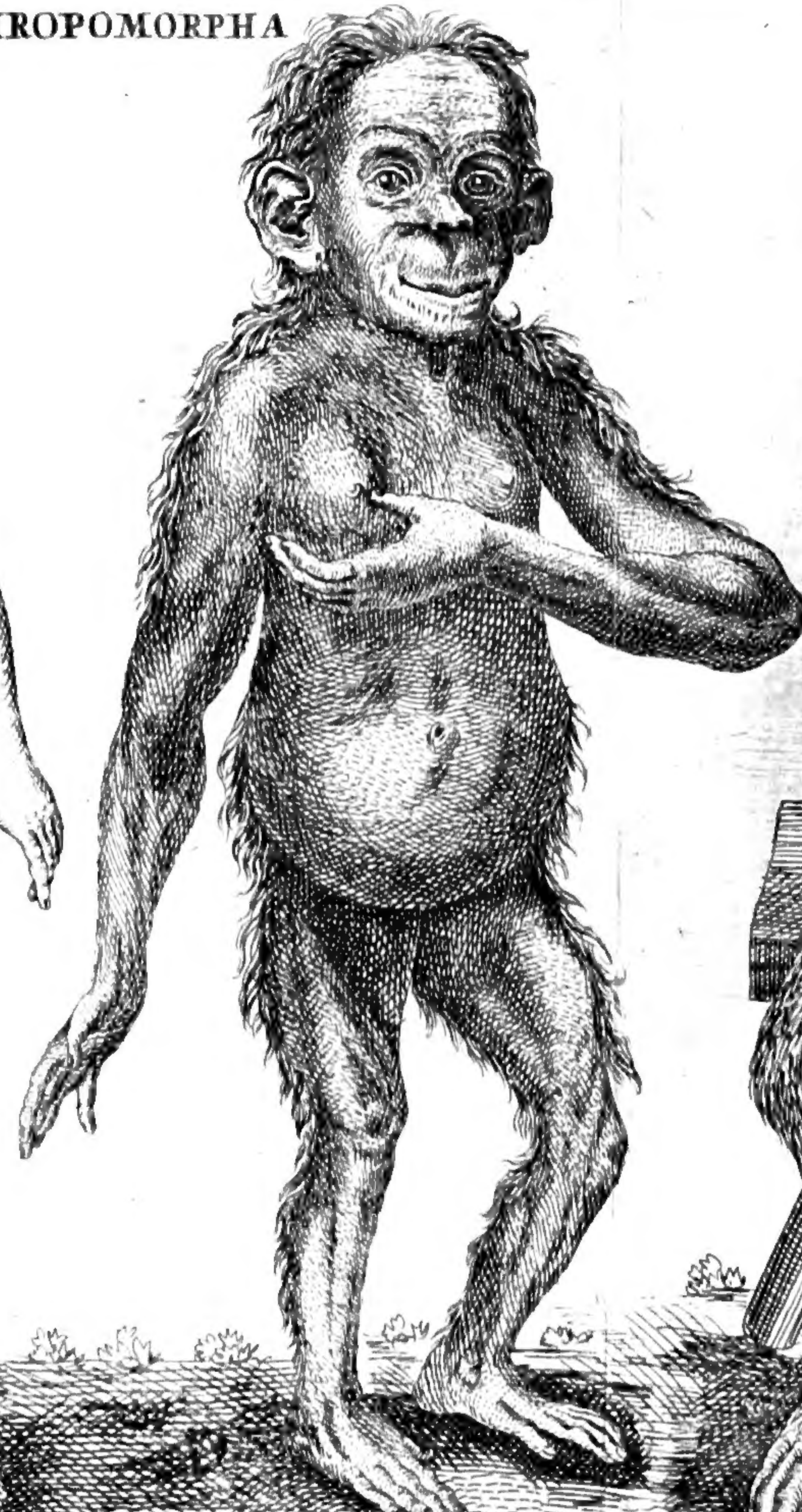
3. SATYRUS Tulpi