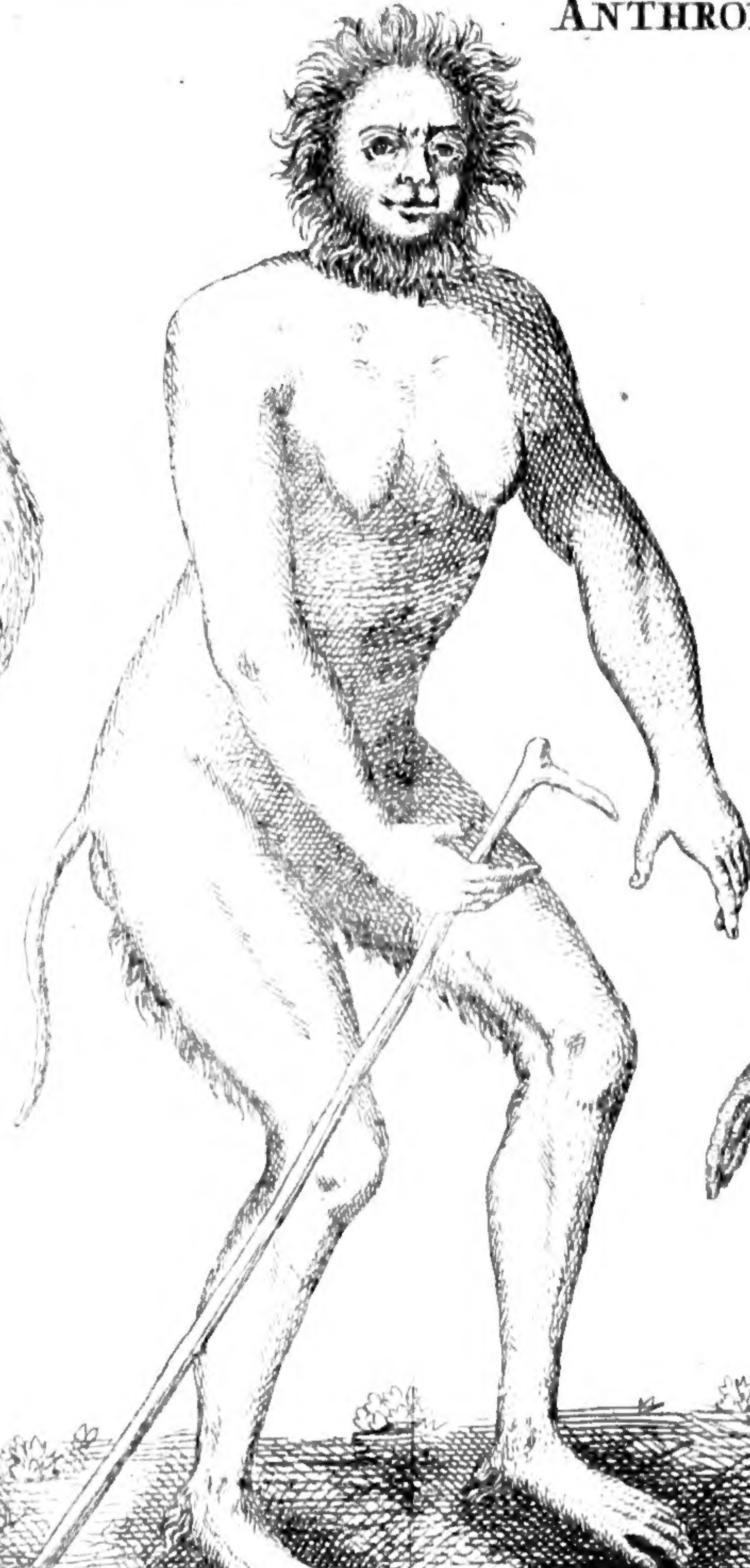
2. LUCIFER Aldrovandi