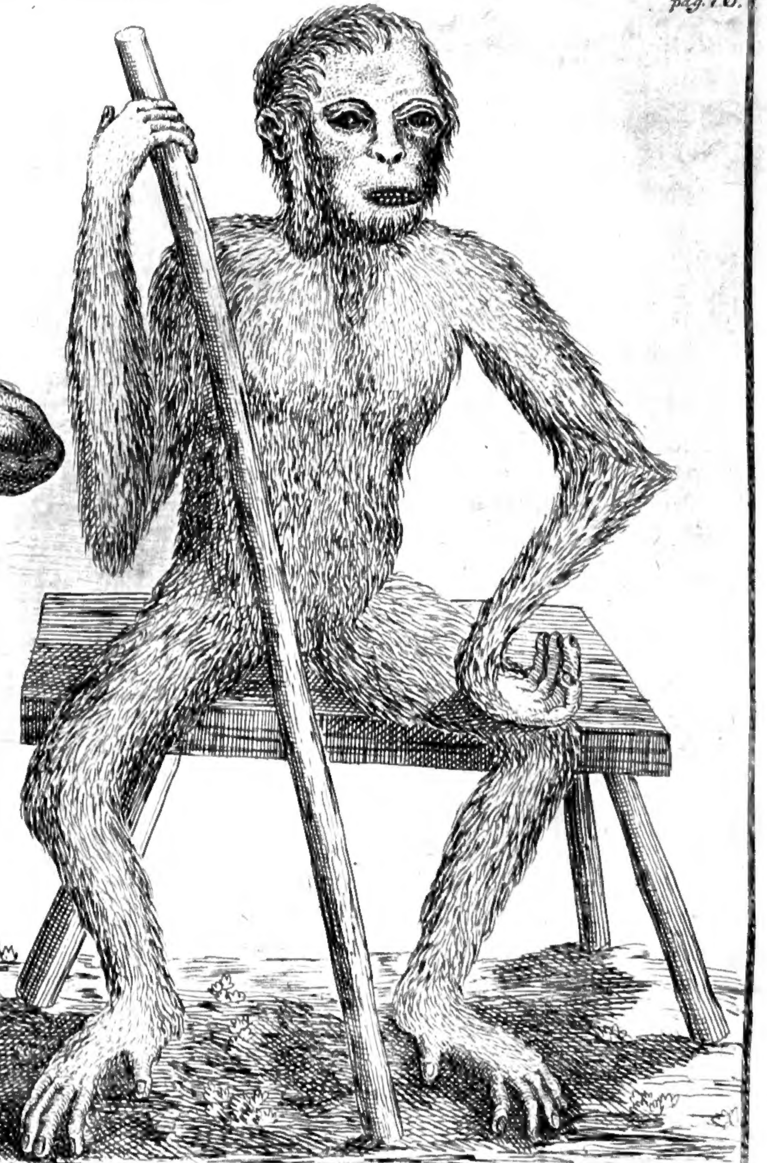
4. PYGMÆUS Edwardi