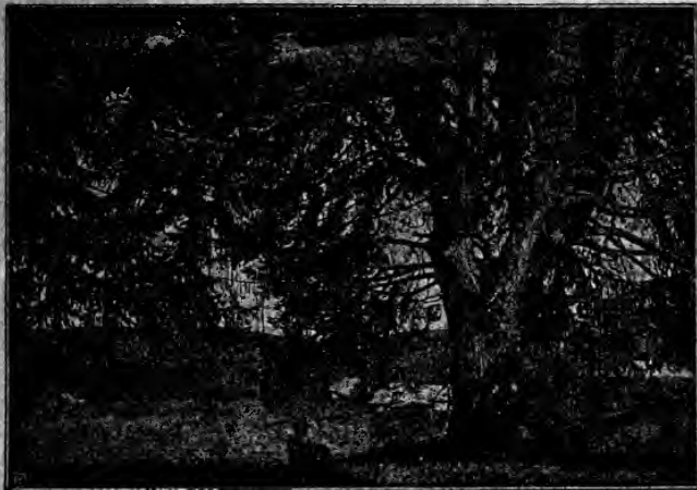
Schwarzwaldtanne. Von Walter Cong.

Auch in der Schule finden die Bilder immer mehr Eingang. Maßgebende Pädagogen haben den hohen Wert der Bilder anerkannt, mehrere Regierungen haben das Unternehmen durch Ankauf und Empfehlung unterstützt.