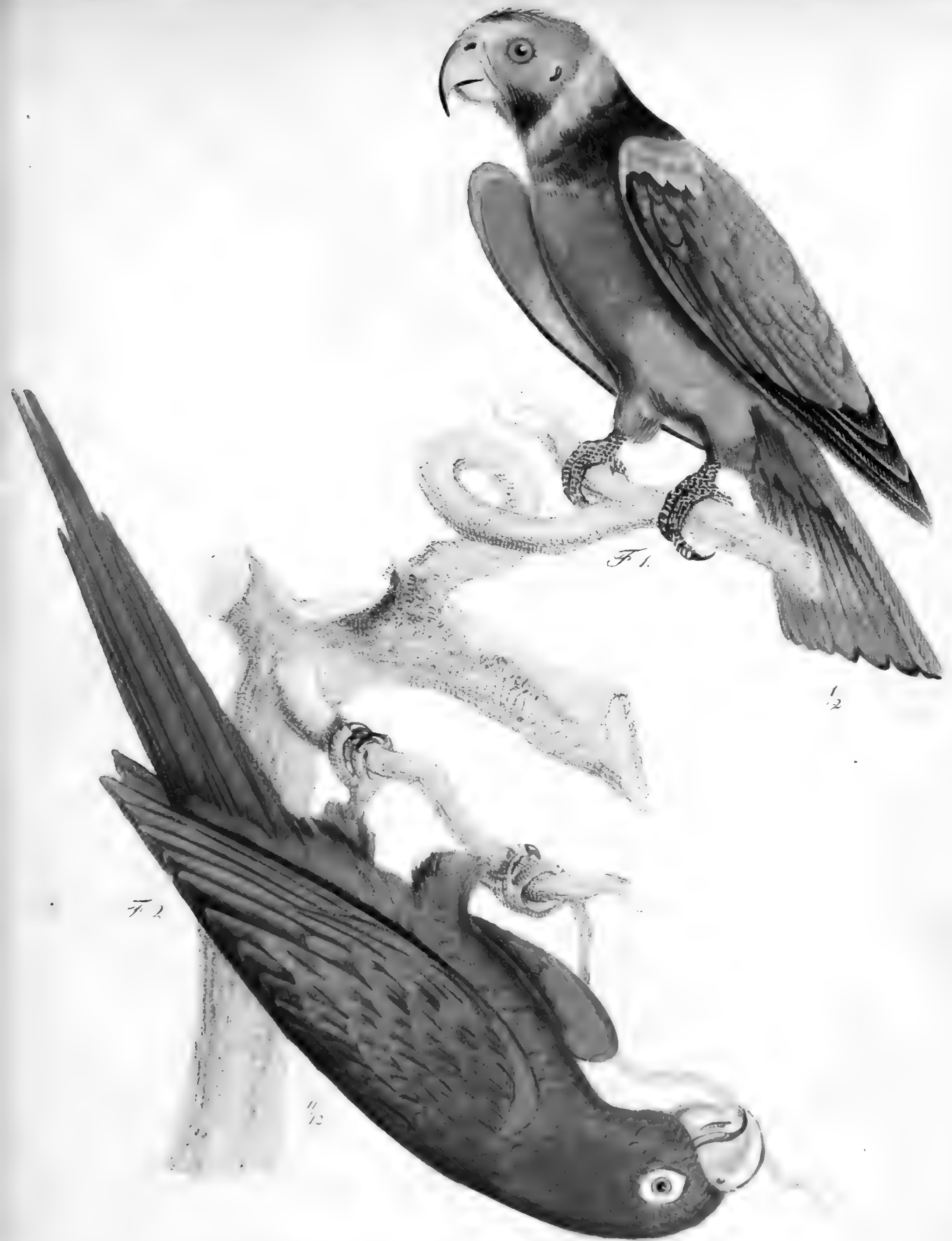
Vireo carolinensis , et Vireo carolinensis