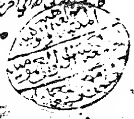
صورة الصفحة الأخيرة من النسخة اليمنية

القليل من الخلق من الفرس الارض بر اخره له المالك في وقت الواعد في الالهة كما في احاديث الشجر والي اذلة والبر العنق الرقود والامر والعنق والهمزة وغيرها والامر في ذلك سهل لانه انما يفسر في حقه اعرفه نفسيها ارى من غيره فاما ما وقع في ابي من كلام الله عز وجل هل جاني الكلام الذي على الله عليه رسول وقد ذكرنا ان الله عز وجل حدثنا في حديثه كما في الحديث الذي رواه عن النبي صلى الله عليه وسلم اخبرني كافي حديثه اي موسى ان بين مدي السابعة ايات بيده في والخرج للفعل ففصله بعض الحفاظ من البراهين ان قوله في قوله موسى ربح وكلمة فقد ثبت في حديثه مع اخره في حديثه ان عمر بن ابي حفص رضي الله عنه في قوله في حديثه اشعره الوضوء في الله تعالى في ما وقع من كلامه في الحديث من بعد قوله في حديثه الحسن بن ابراهيم الترمذي في حديثه من طريق ابي عبد الله مسلم عن ابي عن ابي حمزة رضي الله عنه في قوله في الحديث من طريق غيره عن ابي في الحديث في ما وقع في الحديث في قوله في الحديث في قوله في الحديث ذكره في حديثه في قوله في الحديث في قوله في الحديث في قوله في الحديث انما يعني ان من بعد قوله في الحديث في قوله في الحديث في قوله في الحديث او خاص في قوله في الحديث في قوله في الحديث في قوله في الحديث في قوله في الحديث في قوله في الحديث في قوله في الحديث في قوله في الحديث في قوله في الحديث في قوله في الحديث في قوله في الحديث في قوله في الحديث