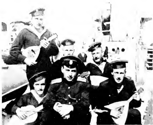
Авторъ на „Финнѣ“

Въ памяти съ огромной яркостью воскресъ весь