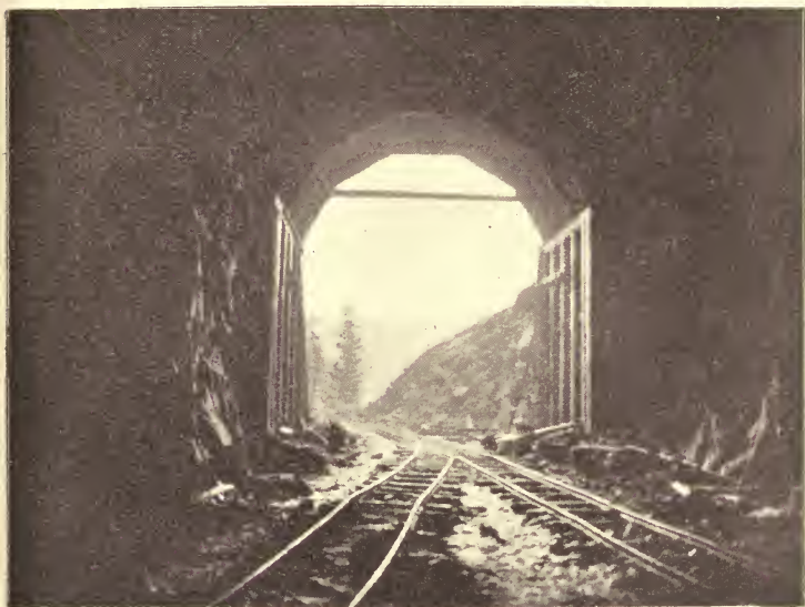
En Great-Northern Tunnelport

»Prærieskonnerten« til Befordringsmiddel, en svær 4 hjulet Kærre med Sejldugstag over og et Dusin Heste eller Okser som Forspand; da maatte man opsøge Dalstrøgene og køre lange Omveje. Nu er det en let Rejse; nu suser man paa Dampens Vinger op over selve Bjergtoppene til over 10,000 Fods Højde. Der løber 3 mægtige Bjergkæder gennem det vestlige Nordamerika i Retning: Nord-Syd. Den østlige Kæde hedder »Klippebjergene«; den