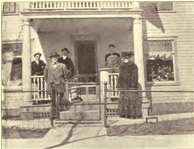
Fra Onkels Hjem i Nebraska.

Hvad vi dernæst lægger Mærke til, er Staaltraadsfletningerne (screens), for Vinduer og Døre. Somme Tider er ogsaa »Porcherne« ompændt med et saadant Fletværk. Det er saa temmelig nødvendigt i den varme Aarstid, da der ellers ikke vilde være til at eksistere for Fluer og »Moskitoer«. Disse sidste er blot, hvad vi hjemme kalder