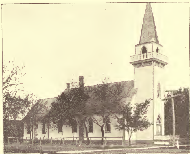
En dansk-amerikansk Kirke.

Det er i Danmark kun lidet kendt, at der herovre findes talrige danske Menigheder og Gudstjeneste paa Modersmaalet. Det er for Landsmænd i Almindelighed og for