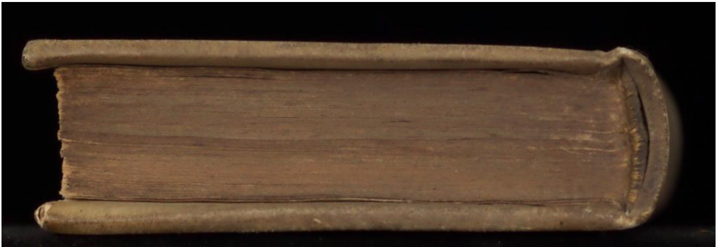
Early European Books, Copyright © 2011 ProQuest LLC. Images reproduced by courtesy of Koninklijke Bibliotheek, Den Haag. 2 H 6