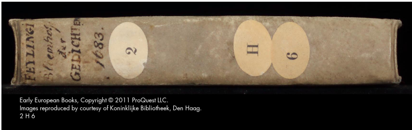
2 H 6