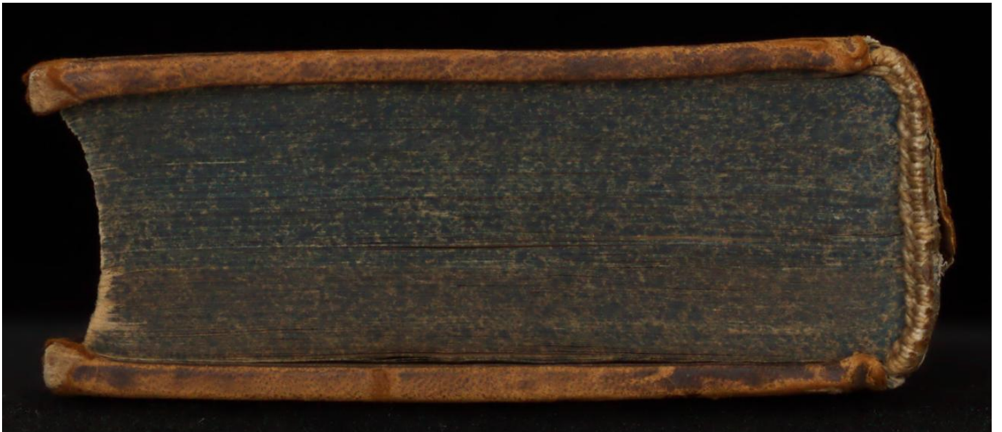
188 L 7 [1]