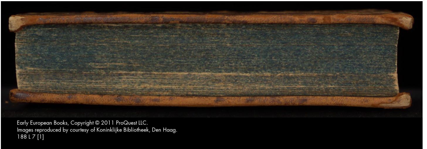
Early European Books, Copyright © 2011 ProQuest LLC. Images reproduced by courtesy of Koninklijke Bibliotheek, Den Haag. 188 L 7 [1]