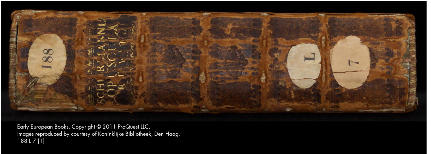
Early European Books, Copyright © 2011 ProQuest LLC. Images reproduced by courtesy of Koninklijke Bibliotheek, Den Haag. 188 L 7 [1]