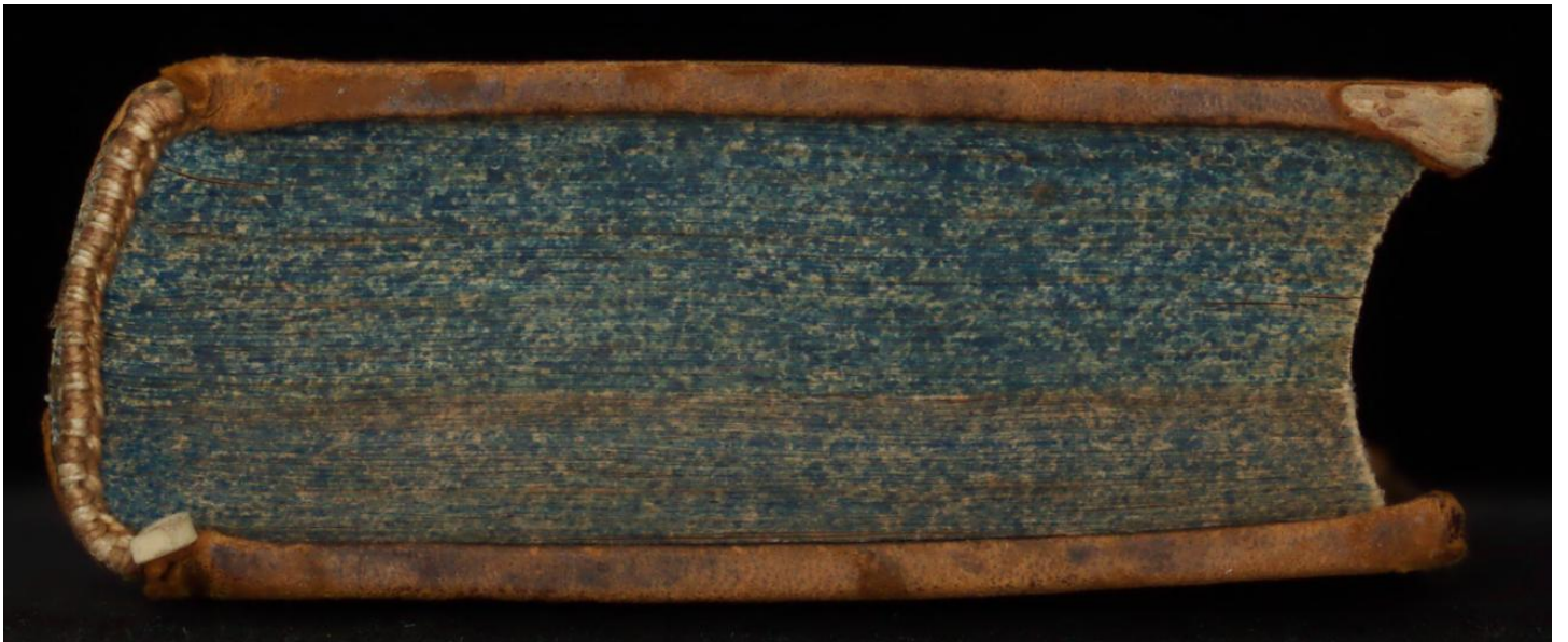
188 L 7 [1]