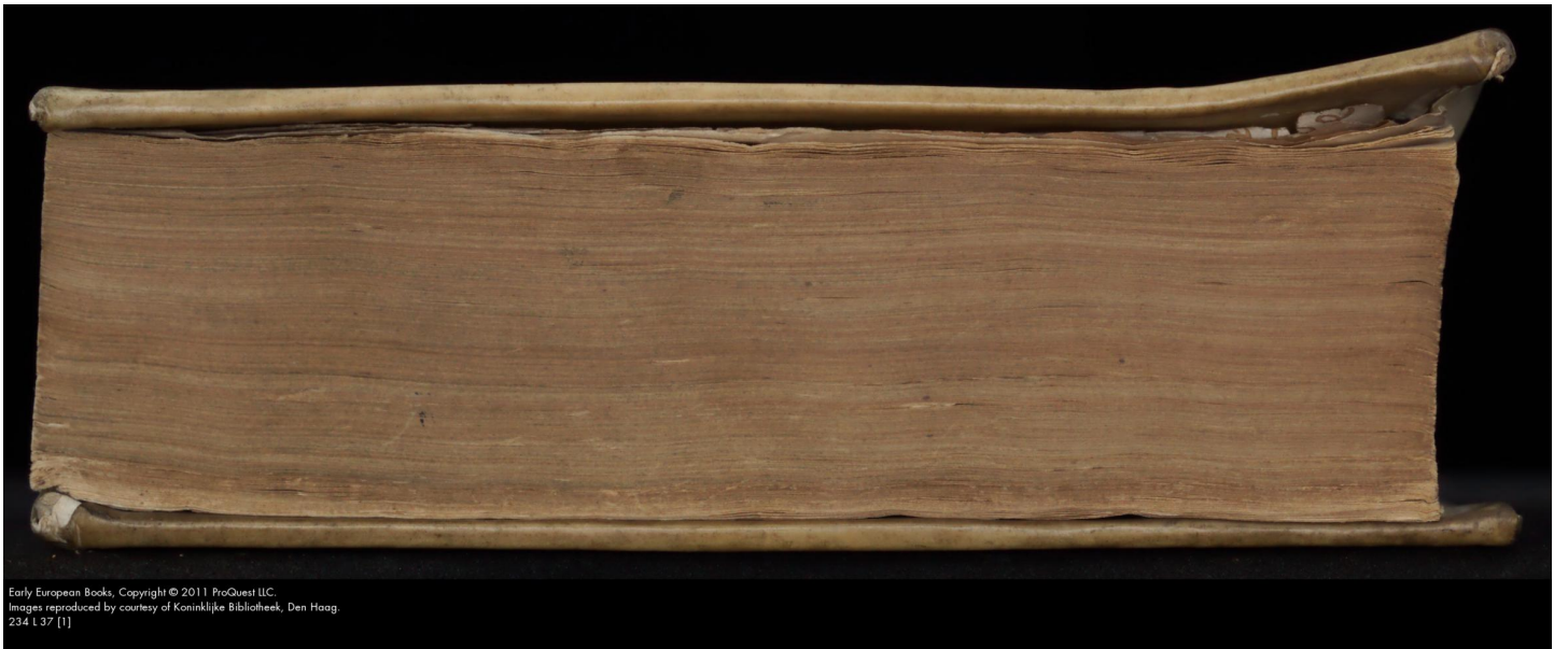
234 L37 [1]