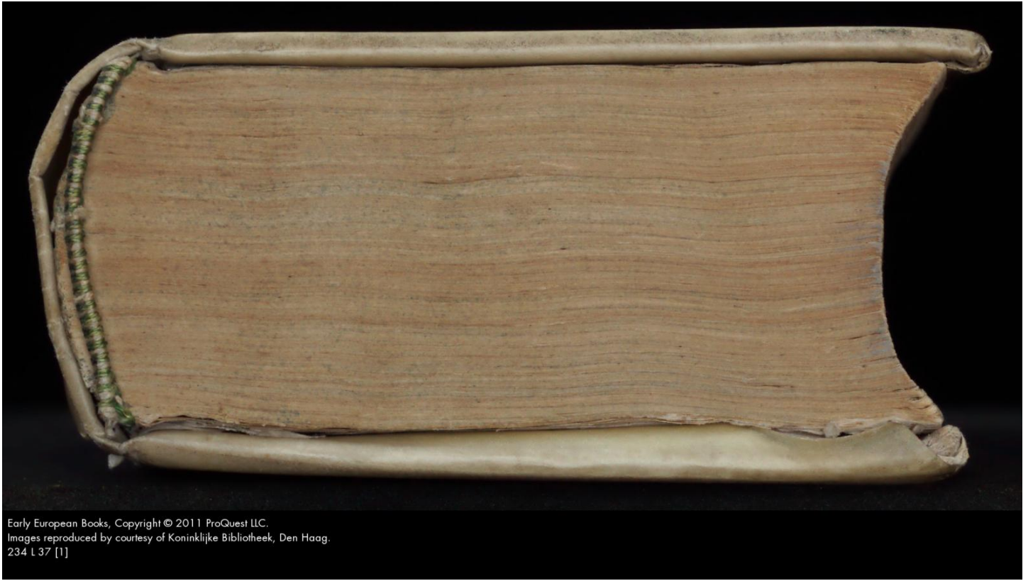
234 L 37 [1]