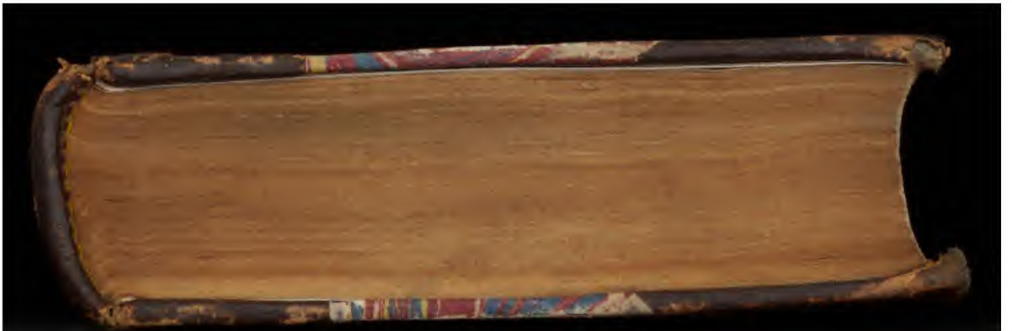
Early European Books, Copyright © 2011 ProQuest LLC. Images reproduced by courtesy of Koninklijke Bibliotheek, Den Haag. 344 J 26 [1]