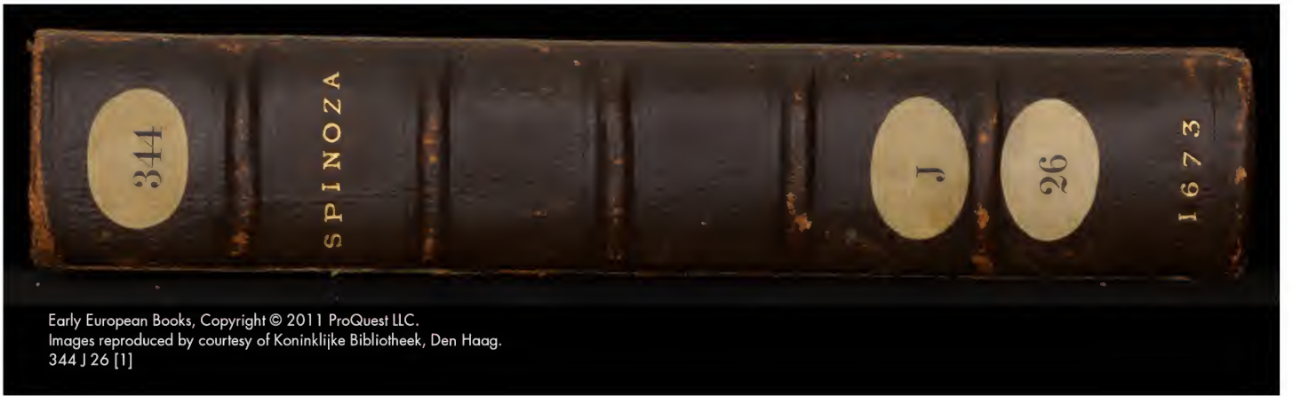
Early European Books, Copyright © 2011 ProQuest LLC. Images reproduced by courtesy of Koninklijke Bibliotheek, Den Haag. 344 J 26 [1]