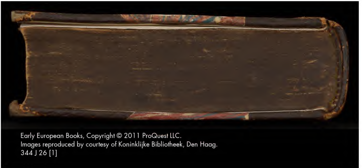
344 J 26 [1]