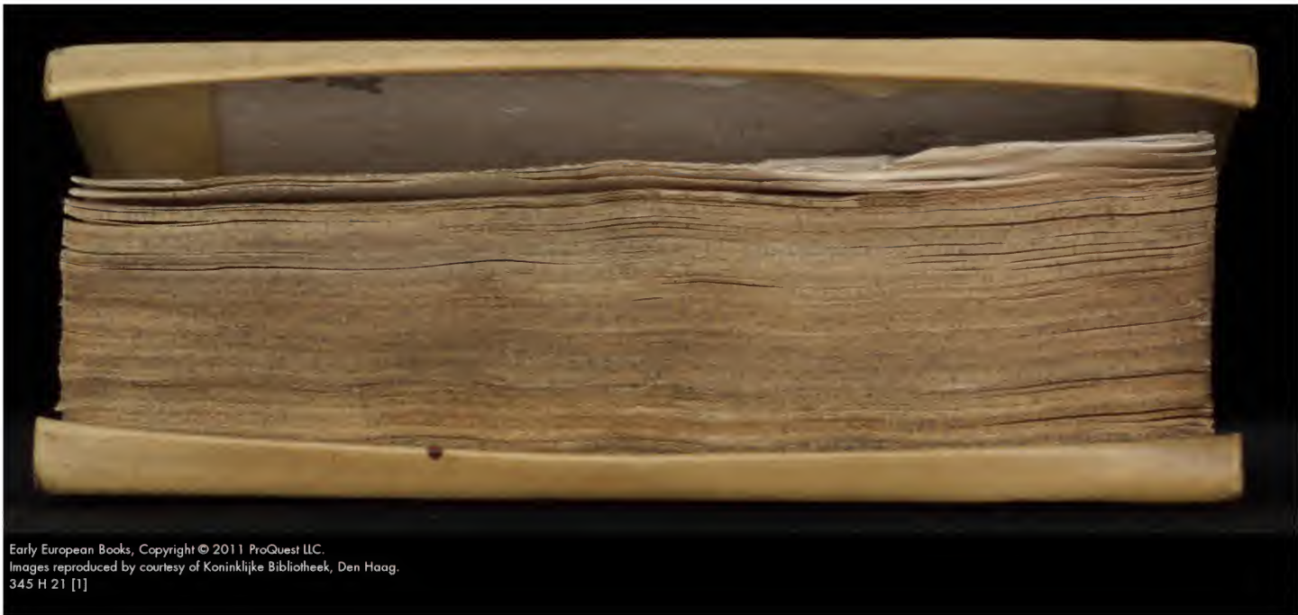
Early European Books, Copyright © 2011 ProQuest LLC. Images reproduced by courtesy of Koninklijke Bibliotheek, Den Haag. 345 H 21 [1]