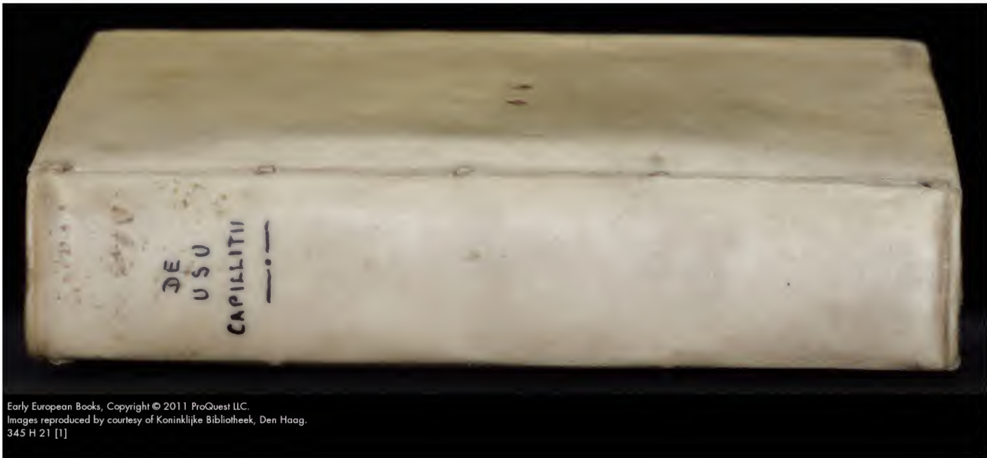
345 H 21 [1]