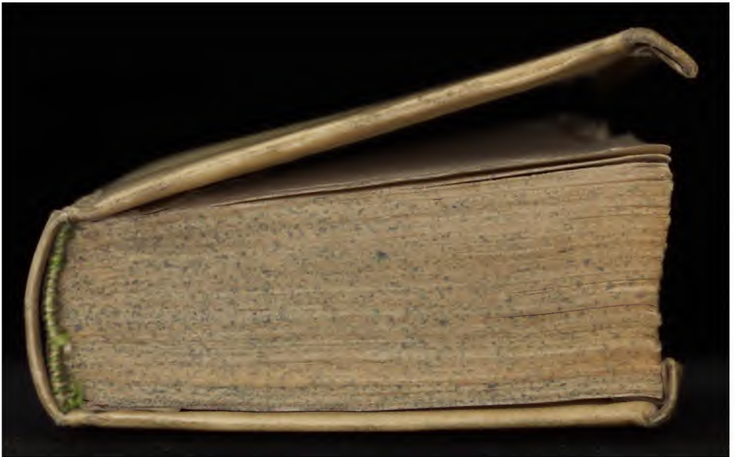
Early European Books, Copyright © 2011 ProQuest LLC. Images reproduced by courtesy of Koninklijke Bibliotheek, Den Haag. 345 H 21 [1]