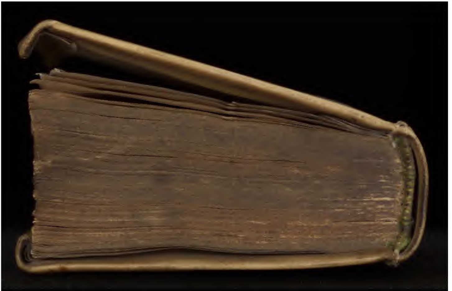
345 H 21 [1]