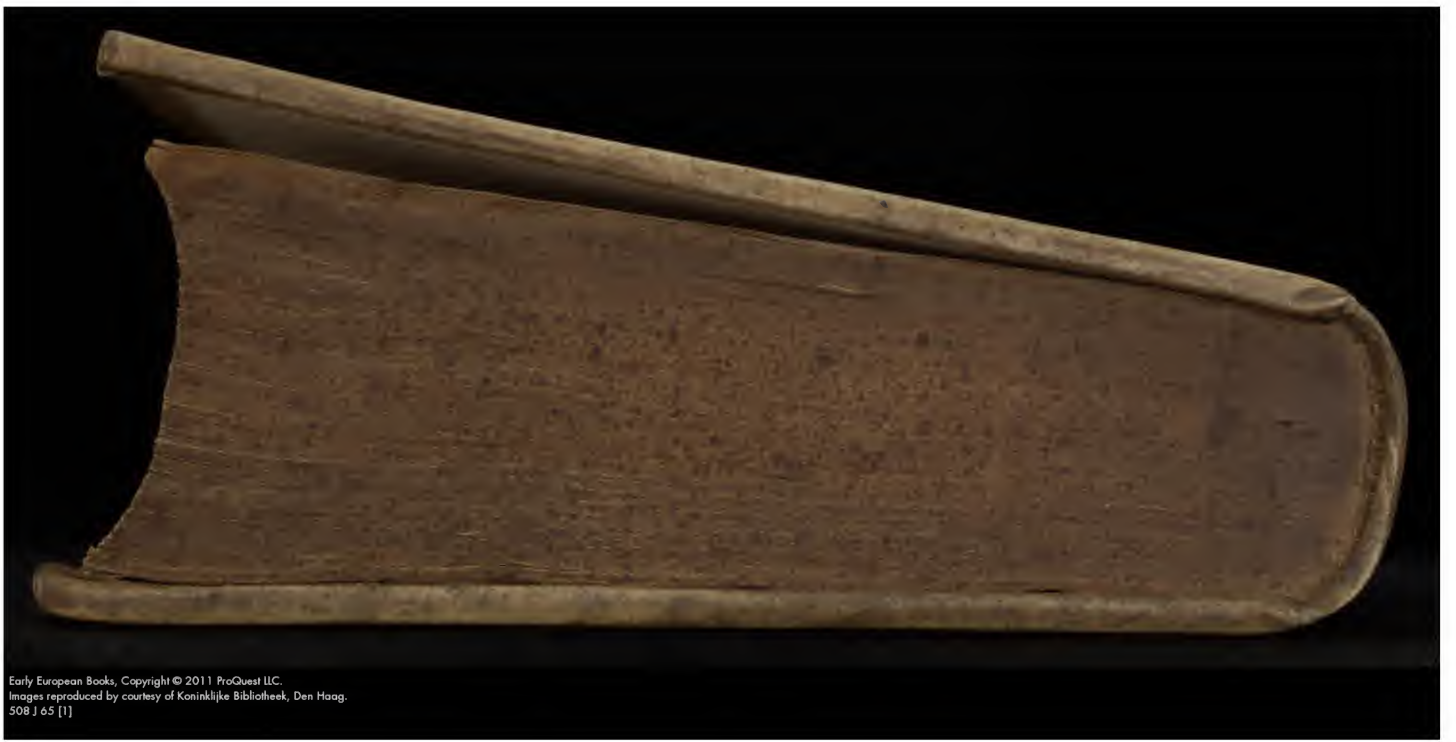
508 J 65 [1]