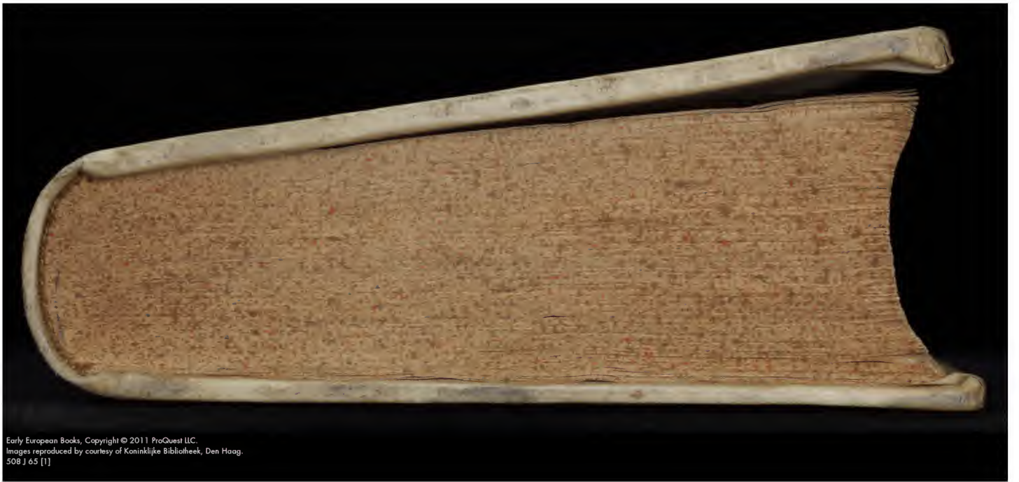
508 J 65 [1]