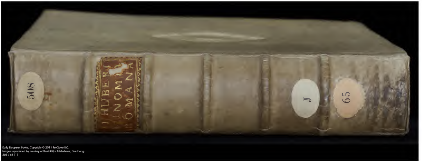
508 J 65 [1]